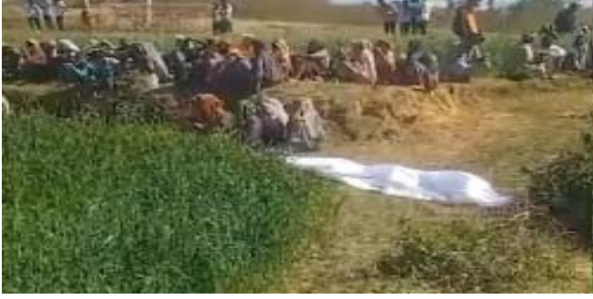
વર્ષથી પુરુષનો મૃતદેહ મળી આવ્યો હતો. આ મૃતદેહ ખૂબ જ ગંભીર હાલતમાં હતો, જેને જોતા એવુ લાગીરહુ હતું કે, તેના ચહેરા પર કોઈએ તીક્ષ્ણ હથિયાર વડે મારવામાં આવ્યું હતું. હાલમાં કોઈ અજાણ્યા શખ્સે હત્યા કરી હોવાનું માનવામાં આવી રહ્યું છે. જે અંગે મુતકના દિકરાએ સંતરામપુર પોલીસ મથકે ફરિયાદ દાખલ કરી છે. સંતરામપુર પોલીસે ફરિયાદના આધારે વધુ તપાસ હાથ ધરી છે.

મહિસાગર જિલ્લામાંથી એક સાથે અલગ અલગ જગ્યાએથી બે મૃતદેહો મળી આવતાં ચક્રચાર મચી જવા પામી છે. જેમાં ખાનપુર તાલુકાના ઉડવા ગામના ખેતરમાંથી એક યુવકનો મૃતદેહ મળી આવ્યો છે. માહિતી પ્રમાણે આ યુવક કડિયા કામે ગયો હતો. જે બાદ તેનો મૃતદેહ મળી આવતાં આ આત્મહત્યા હતી કે મરેડ તે અંગે હાલમાં કોઈ માહિતી નથી. હાલમાં પોલીસ મૃતદેહને પીએમ અર્થે મોકલવાને પોલીસે આ અંગે વધુ તપાસ હાથ ધરી છે. તો બીજી તરફ સંતરામપુર તાલુકાના કાળીમીલ ગામમાંથી પણ વર્ષથી પુરુષનો મૃતદેહ મળી આવ્યો હતો. આ મૃતદેહ ખૂબ જ ગંભીર હાલતમાં હતો, જેને જોતા એવુ લાગીરહુ હતું કે, તેના ચહેરા પર કોઈએ તીક્ષ્ણ હથિયાર વડે મારવામાં આવ્યું હતું. હાલમાં કોઈ અજાણ્યા શખ્સે હત્યા કરી હોવાનું માનવામાં આવી રહ્યું છે. જે અંગે મુતકના દિકરાએ સંતરામપુર પોલીસ મથકે ફરિયાદ દાખલ કરી છે. સંતરામપુર પોલીસે ફરિયાદના આધારે વધુ તપાસ હાથ ધરી છે.