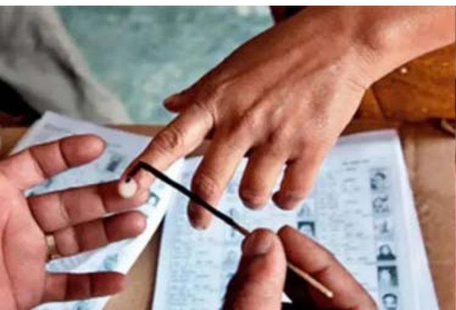
વિસ્તારમાં વૈકલ્પિક વ્યવસ્થા તરીકે આવા કર્મચારી-કામદારોને મતદાન માટે વારફરતી ત્રણ કલાકની રજા આપવામાં આવશે અથવા જે દિવસે સામાજિક રજા હોય તે દિવસે સંસ્થા ચાલુ રાખીને અવેજીમાં કે બદલીમાં મતદાનના દિવસે રજા આપવામાં આવે તેવી વ્યવસ્થા કરવાની રહેશે. ગુજરાત રાજ્ય ચૂંટણી આયોગ કમિશ્નર ડૉ. એસ. મુરલી કિષ્નાએ પ્રેસ કોન્ફરન્સ કરીને સ્થાનિક સ્વરાજ્યની ચૂંટણીની તારીખો જાહેર કરી છે. જે અનુસાર, ૧૬ ફેબ્રુઆરીના રોજ મતદાન થશે. જ્યારે ૧૮ ફેબ્રુઆરીના રોજ મતગણતરી યોજવામાં આવશે. ધાનેરા નગરપાલિકાની ચૂંટણીનો કાર્યક્રમ જાહેર નથી કરાયો.

ગુજરાત રાજ્યની મહાનગરપાલિકા, નગરપાલિકા, જિલ્લા પંચાયત અને તાલુકા પંચાયતોની સમાન્ય/મધ્યસત્ર/પેટા ચૂંટણીનું મતદાન ૧૬ ફેબ્રુઆરીના દિવસે યોજાશે. રવિવારે સવારે ૭ વાગ્યાથી સાંજના ૬ વાગ્યા સુધી મતદાન યોજાશે. મતદાનના દિવસે શ્રમયોગી કર્મચારીઓ માટે મહત્ત્વનો નિર્ણય લેવામાં આવ્યો છે. શ્રમયોગી કર્મચારીઓને મતદાનના દિવસે સવેતન રજા આપવાની જાહેરાત કરવામાં આવી છે. નોંધનીય છે કે, મતદાનના દિવસે જે-તે વિસ્તારમાં ગુજરાત શોપ્સ એન્ડ કંડીશન્સ એન્ડ સર્વિસ) એક્ટ, ૨૦૧૮ હેઠળ નોંધાયેલી સંસ્થાઓના શ્રમયોગી-કર્મચારીઓ પોતાના મતાધિકારનો ઉપયોગ કરી શકે તે માટે ખાસ સુવિધા કરવામાં આવી છે. ચૂંટણી હેઠળના સમગ્ર વિસ્તારમાં વૈકલ્પિક વ્યવસ્થા તરીકે આવા કર્મચારી-કામદારોને મતદાન માટે વારફરતી ત્રણ કલાકની રજા આપવામાં આવશે અથવા જે દિવસે સામાજિક રજા હોય તે દિવસે સંસ્થા ચાલુ રાખીને અવેજીમાં કે બદલીમાં મતદાનના દિવસે રજા આપવામાં આવે તેવી વ્યવસ્થા કરવાની રહેશે. ગુજરાત રાજ્ય ચૂંટણી આયોગ કમિશ્નર ડૉ. એસ. મુરલી કિષ્નાએ પ્રેસ કોન્ફરન્સ કરીને સ્થાનિક સ્વરાજ્યની ચૂંટણીની તારીખો જાહેર કરી છે. જે અનુસાર, ૧૬ ફેબ્રુઆરીના રોજ મતદાન થશે. જ્યારે ૧૮ ફેબ્રુઆરીના રોજ મતગણતરી યોજવામાં આવશે. ધાનેરા નગરપાલિકાની ચૂંટણીનો કાર્યક્રમ જાહેર નથી કરાયો.