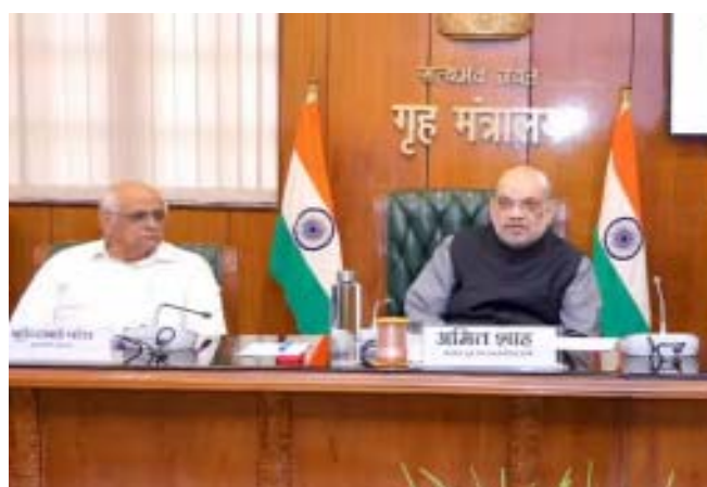
દાખલ કરવાનું પ્રશંસનીય કાર્ય કર્યું છે.

,નવીદિલ્હી,તા.૩૧ કેન્દ્રીય ગૃહ અને સહકાર મંત્રી અમિત શાહે શુક્રવારે નવી દિલ્હીમાં ગુજરાતના મુખ્યમંત્રી ભૂપેન્દ્ર પટેલની હાજરીમાં રાજ્યમાં ૩ નવા ફોજદારી કાયદાઓના અમલીકરણ અંગે સમીક્ષા બેઠકની અધ્યક્ષતા કરી હતી. આ બેઠકમાં ગુજરાતમાં પોલીસ, જેલ, અદાલત, ફરિયાદ અને ફોરેન્સિક સંબંધિત વિવિધ નવી જોગવાઈઓના અમલીકરણ અને વર્તમાન સ્થિતિની સમીક્ષા કરવામાં આવી હતી. આ બેઠકમાં ગુજરાતના ગૃહ રાજ્યમંત્રી, કેન્દ્રીય ગૃહ સચિવ, મુખ્ય સચિવ અને ગુજરાતના પોલીસ મહાનિરીક્ષક, રાષ્ટ્રીય ગુના રેકોર્ડ બ્યુરોના મહાનિરીક્ષક અને કેન્દ્રીય ગૃહ મંત્રાલય અને રાજ્ય સરકારના અનેક વરિષ્ઠ અધિકારીઓ હાજર રહ્યા હતા.