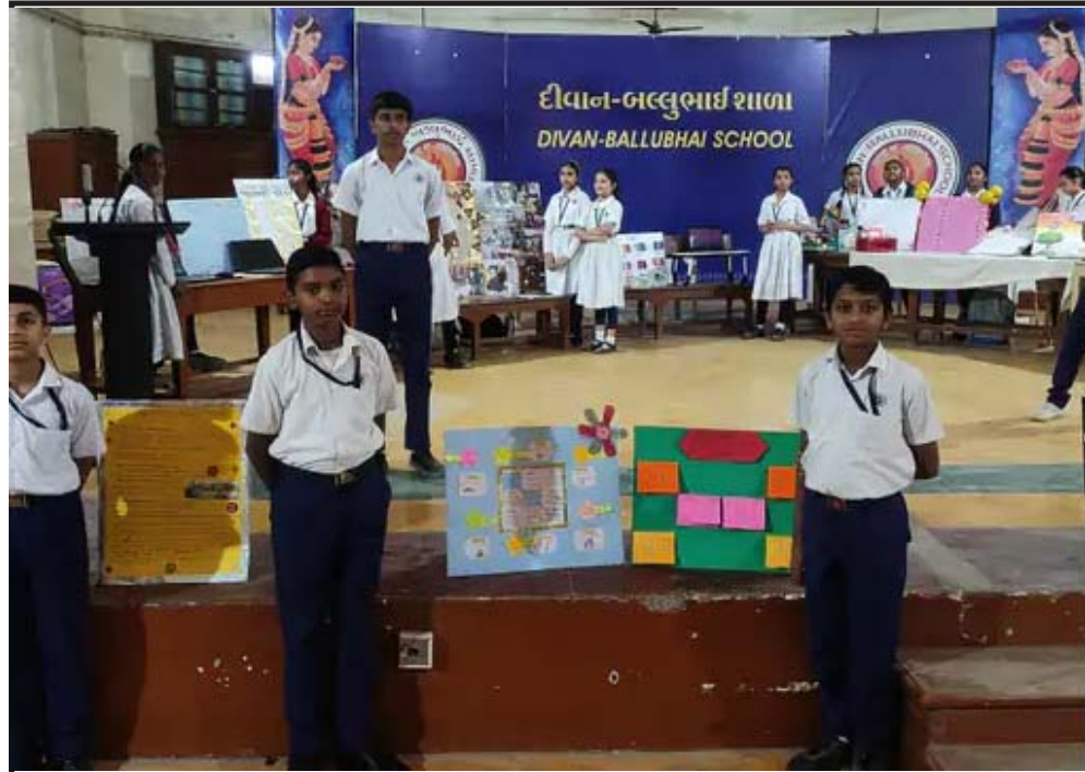
કાંકરિયાની દીવાન-બલ્લુભાઈ પ્રાથમિક શાળામાં 'અંગ્રેજી મેળો' યોજાયો: