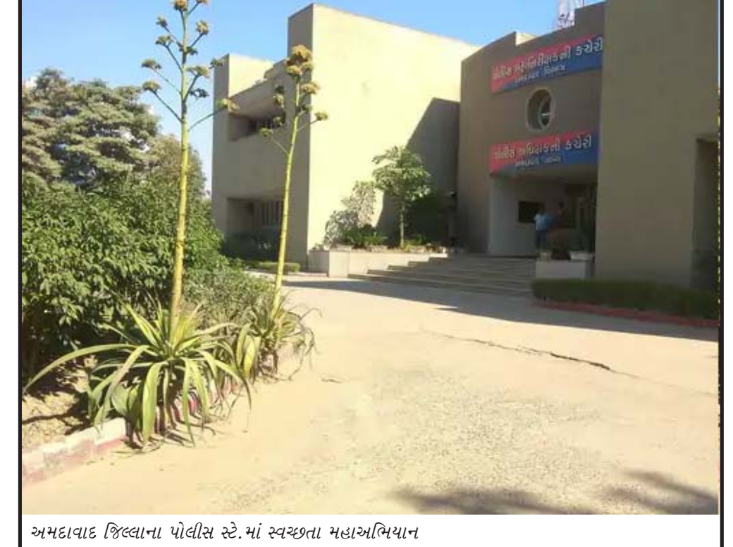
અમદાવાદ જિલ્લાના પોલીસ સ્ટે.માં સ્વચ્છતા મહાઅભિયાન