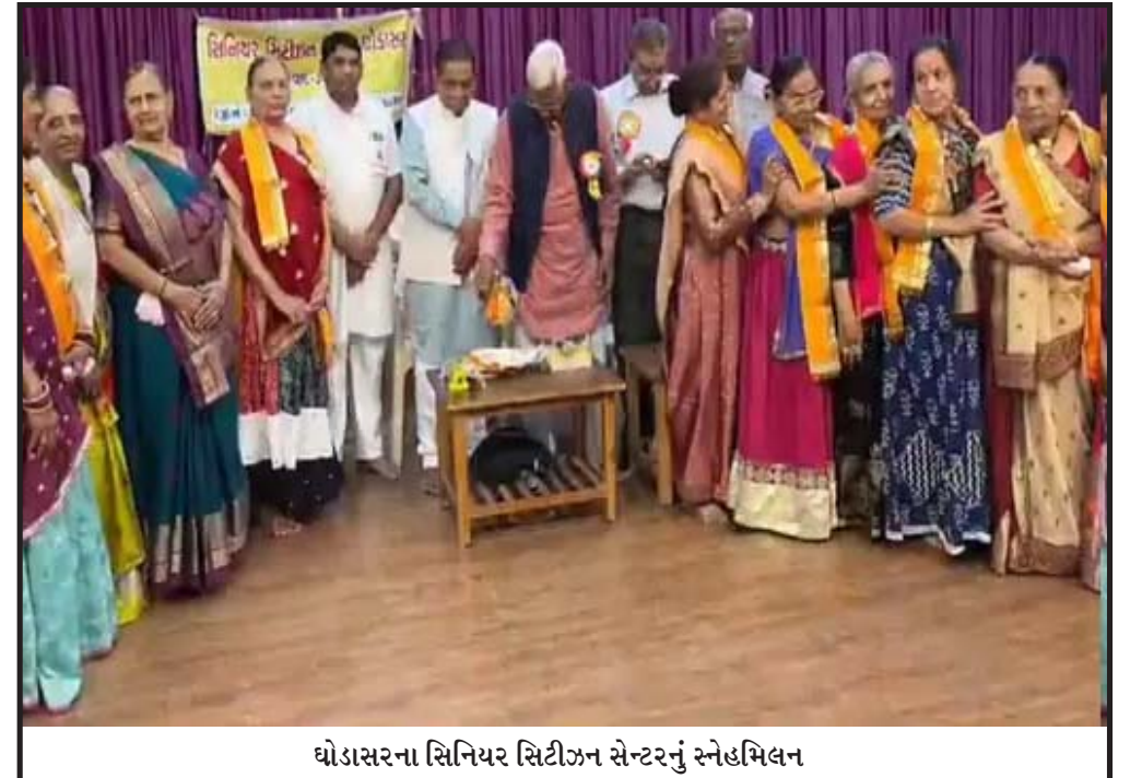
ઘોડાસરના સિનિયર સિટીઝન સેન્ટરનું સ્નેહમિલન

થાકેલા કહ્યા. આદિવાસી ઠીકરી બોલે ત્યારે તેમને કંટાળાજનક લાગે છે. આ દેશના દસ કરોડ આદિવાસી ભાઈ-બહેનોનું અપમાન છે. આ દેશના દરેક ગરીબ વ્યક્તિનું અપમાન છે. કોંગ્રેસનો રાજવી પરિવાર ગરીબ, દલિત, આદિવાસી, ઓબીસી સમુદાયમાંથી આગળ આવતા લોકોને દરેક પગલે અપમાનિત કરે છે.