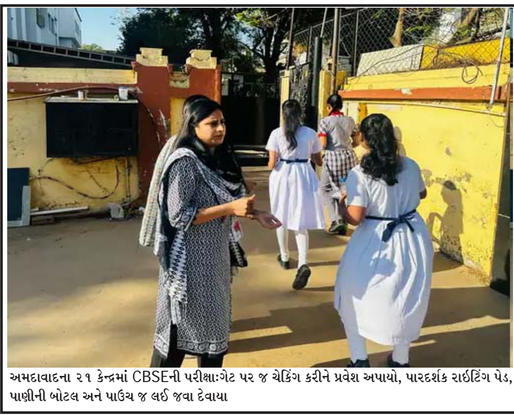
અમદાવાદના ૨૧ કેન્દ્રમાં CBSEની પરીક્ષાગટ પર જ ચેકિંગ કરીને પ્રવેશ અપાયો, પારદર્શક રાઉટિંગ પેડ, પાણીની બોટલ અને પાઉચ જ લઈ જવા દેવાયા

જહાજ અમેરિકાથી આવ્યું ત્યારે કોંગ્રેસ અને આમ આદમી પાર્ટીએ સવાલ ઉઠાવ્યો કે માત્ર અમુતસરને જ કેમ પસંદ કરવામાં આવ્યું? ભગવંત માને કહ્યું કે તેમણે આ પગલાની ટીકા કરી છે, પરંતુ તેમ છતાં તેઓ પાછા આવનારાઓનું સ્વાગત કરશે. તેઓને સુવર્ણ મંદિરના લંગરમાં ભોજન કરાવશે અને તેમના પુનર્વસન માટે શક્ય તમામ મદદ કરશે. માનનો આરોપ છે કે માત્ર પંજાબીઓ જ ગેરકાયદેસર રીતે વિદેશ જાય છે તેવો સંદેશો આપવાનો આ ઈરાદાપૂર્વકનો પ્રયાસ હતો.