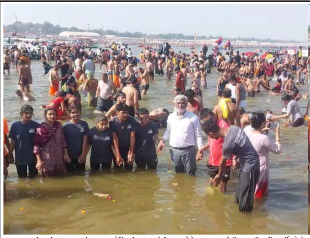
પ્રયાગરાજ કુંભમાં નવજીવન સંસ્થાના મનોદિવ્યાંગ બાળકોનું સ્નાન:કેનેડાના દાતાઓની મદદથી ૮ વિદ્યાર્થીઓએ માણ્યો આધ્યાત્મિક અનુભવ