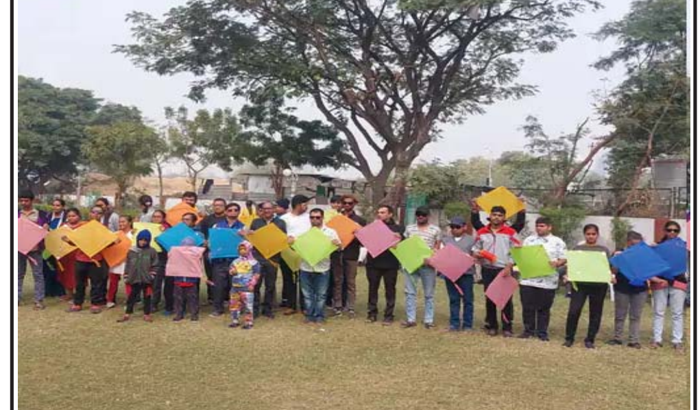
મનોદિવ્યાંગ બાળકોનો પતંગોત્સવ નવજીવન ટ્રસ્ટની સ્કૂલમાં બાળકોએ પતંગ ઉડાવવાની મોજ સાથે ચિક્કી-ઉધિયુંની મિજબાની માણી

બાળકોને ઝાડા અને ઉલટી થતાં બાળકોના પિતા બાળકોને દાવડ સિવિલ હોસ્પિટલમાં લઈ ગયા હતા અને ગાંઠિયાનું પેકેટ ચેક કર્યું તો અંદરથી મરી ગયેલ ઉંદર નીકળ્યો હતો. સૂચો ધ્વારા મળતી માહિતી મુજબ તંત્રની મિલીભગતથી સાબરકાંઠાના કેટલાક વેપારીઓ લોકોના આરોગ્યની કોઈપણ પ્રકારની પરવા કર્યા વગર માત્ર પોતાના આર્થિક કાષ્ટદા માટે પદાર્થોમાં ભેળસેળ કરી રહ્યા છે જેને કારણે ભેળસેળીયા વેપારીઓમાં તંત્રનો ડર રહ્યો નથી. સરકારી ચોપડે બતાવવા પુરતી કામગીરી કરાઈ રહ્યાં અને મોટા હતાએ ઉપર સુધી જતા હોવાનું પણ લોકમુખે ચર્ચાઈ રહ્યું છે અવારનવાર સાબરકાંઠા જિલ્લામાં ખાદ્ય પદાર્થોમાંથી ઉંદર ગરોળી સહિતના મૃત જીવો નીકળવાના બનાવો સામે આવ્યા છે ત્યારે સાબરકાંઠા ખોરાક અને ઔષધી નિયમન વિભાગની કામગીરીને ફક્ત કાગળ ઉપર હોય તે પ્રમાણેના લાગી રહ્યું છે ખોરાક અને ઔષધી નિયમન વિભાગની નિષ્ફળ કામગીરીને પગલે સ્થાનિકોમાં પણ ભારે રોષ જોવા મળી રહ્યો છે.