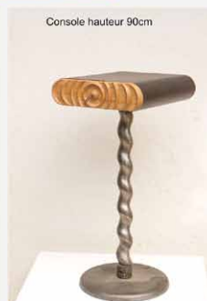
Console hauteur 90cm

LES ARTISTES, ARTISANS ET CRÉATEURS 2025