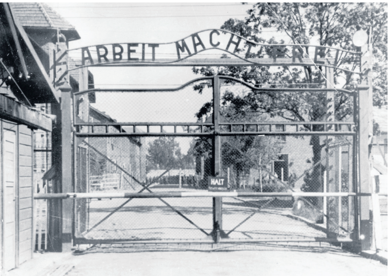
Huvudentrén till förintelseslägret Auschwitz. Här mördades troligen Szlama Friedmans första fru och deras två små döttrar.