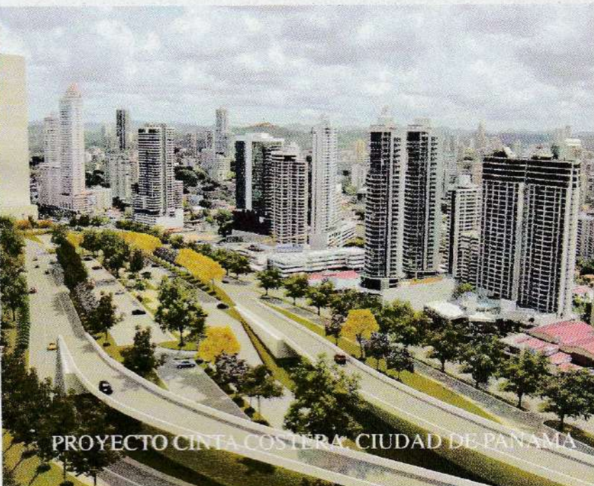
PROYECTO CINTA COSTERA CIUDAD DE PANAMA

Internacional de Tocumen; la cinta Costera; la construcción de varias plantas generadoras térmicas e hidroeléctricas; las interconexiones eléctricas con países vecinos y el nuevo proyecto de transporte moderno para la ciudad de Panamá; son obras de infraestructura que pudieran más que duplicar la inversión de la ampliación del Canal de Panamá durante este mismo período de 7 años.