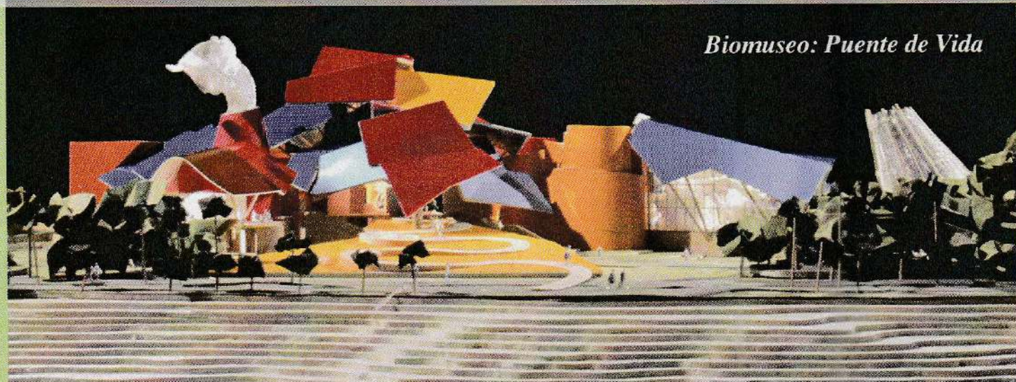
Biomuseo: Puente de Vida

El Biomuseo será el primer edificio en Latinoamérica diseñado por el mundialmente reconocido arquitecto Frank Gehry. Actualmente está en construcción en la Calzada de Amador. Con un avance de más del 50% está planeado para abrir al público a principios del 2010.