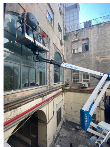
Lavori di manutenzione ordinaria e straordinaria con PLE