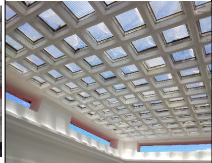
Lavori di manutenzione straordinaria e restauro conservativo