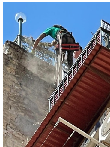
Lavori di manutenzione ordinaria su corde