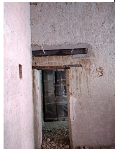
Lavori di consolidamento strutturale