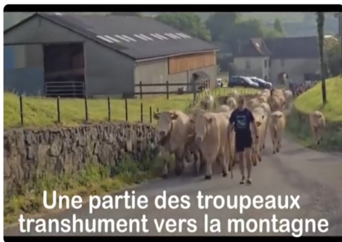
EGAL video viande veau