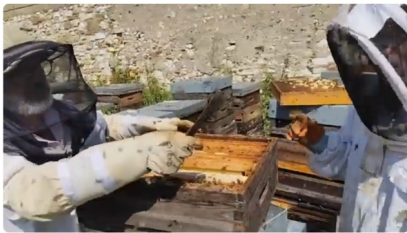
EGAL video miel ezitia abeille bleue

Deux vidéos de découverte - visites de fermes sont proposées aux résidents, offrant une immersion dans les fermes locales et permettant de mieux connaître les personnes qui y travaillent :