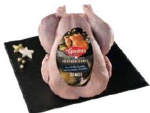
Dinde Le Gaulois

De 2,5 à 3 ou de 3 à 3,5 ou de 3,5 à 4 kg