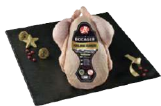
Poularde Fermière le Bocager