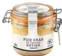
Foie gras de canard domaine de Lanvaux