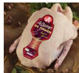
Oie Fermière du Bocager