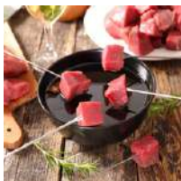
Pièce à fondue de Bœuf ***