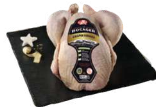
P'tit Chapon Fermier Le Bocager