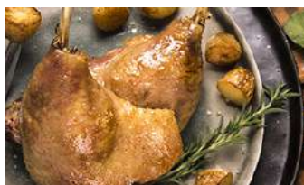
Cuisse de Canard Confité