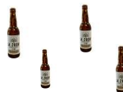
Coffret 4 Bières + 1 Verre