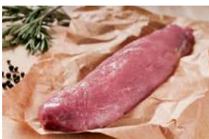
Filet Mignon de Porc