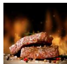
Pavé de Bœuf ***