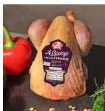
Chapon de Pintade Fermier du Bocager