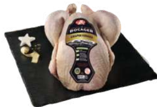
Chapon Fermier Le Bocager