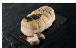
Rôti de Chapon Farci Figue Abricot