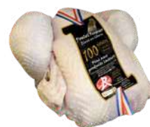
Poulet Grand Maître 100 Jours