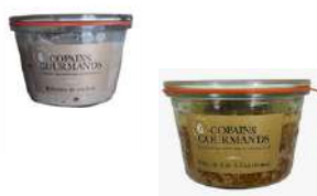
Bocaux de Rillettes ou pâte du perche