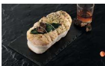
Rôti de Chapon Farci Morilles Armagnac