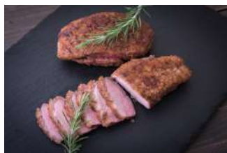
Magret de Canard Domaine de Lanvaux