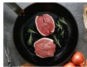
Tournedos Filet de Canard Domaine de Lanvaux