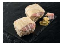
Choux Farci de dinde Orloff