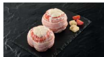
Paupiettes de Dinde Farcies Orloff