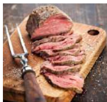
Rôti de Bœuf ***