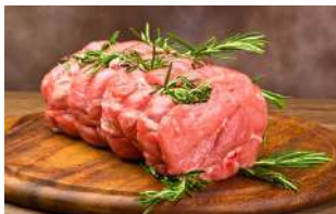
Rôti de Veau ***