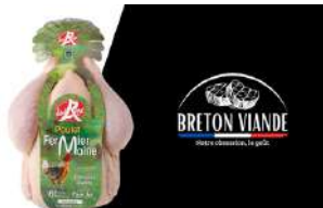
Poulet Fermier du Maine