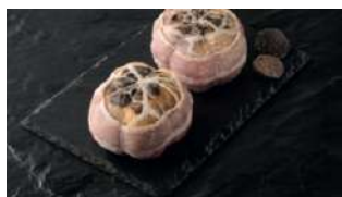
Paupiettes de Pintade Farcies Truffe