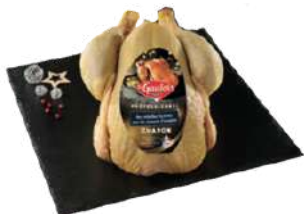
Chapon Le Gaulois