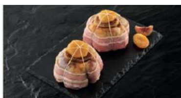
Paupiettes de Pintade Farcies au Foie Gras et aux Figues