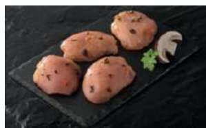
Médallions de poulet au cèpes