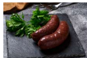
Boudin Noir ou Boudin Blanc Grelot

X200g env. 15 petits boudins grelot environ 600g