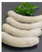
Boudin Blanc Nature ou Forestier ou Oignons Lardons ou Pommes Chataignes