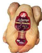
Dinde Fermière du Bocager