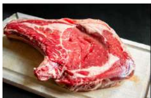
Côte de Bœuf