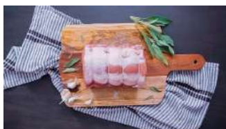
Rôti Filet ou Rôti Echine de Porc