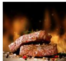
Pavé de Veau ***