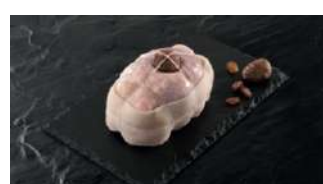
Ballotins de Dinde Farcis Marrons Raisins