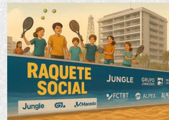
BANNER EM QUADRA