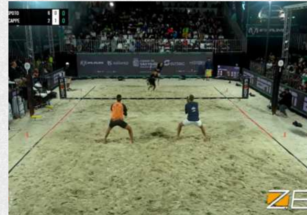
LOGOS EM CARROSSÉIS