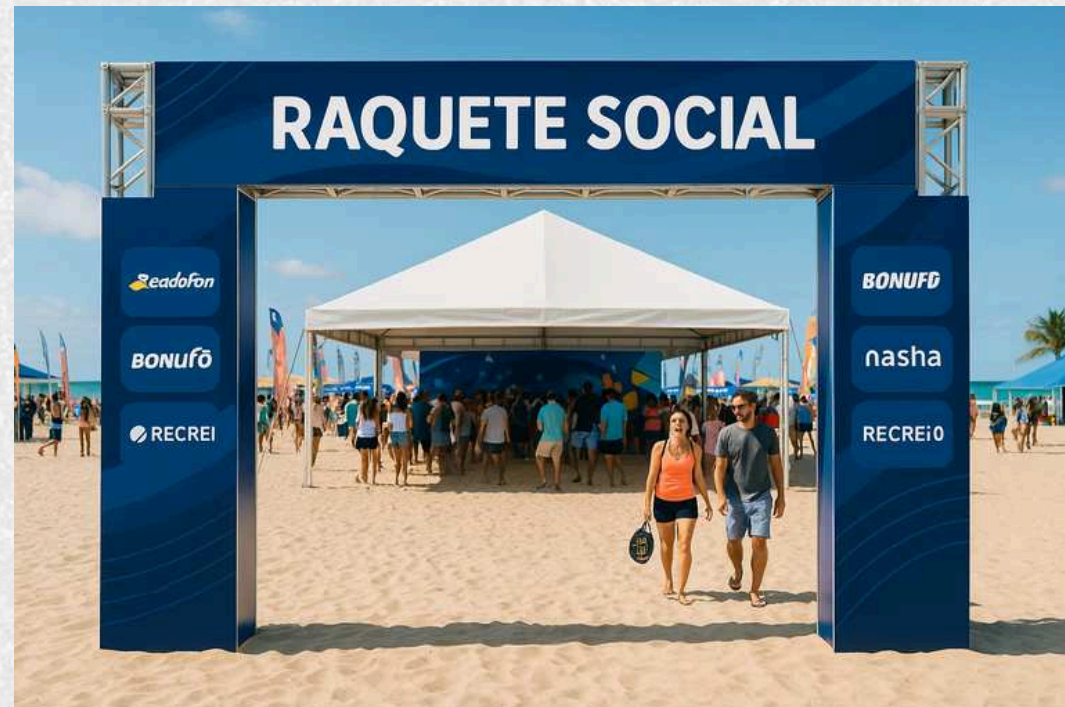
PÓRTICO DE ENTRADA