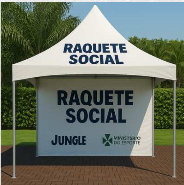
TENDA COM LOGO