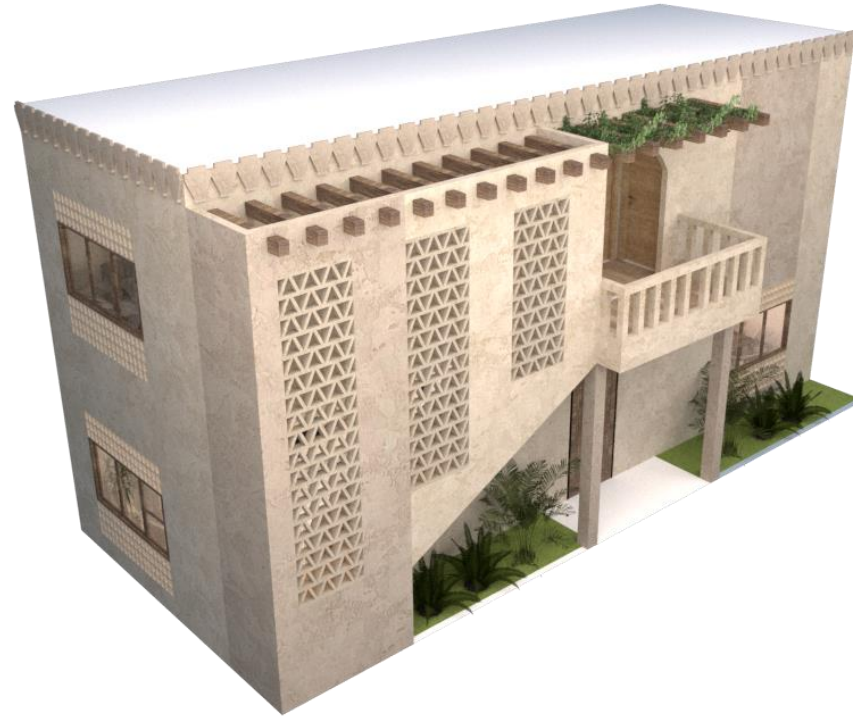
منظور لواجهات النموذج