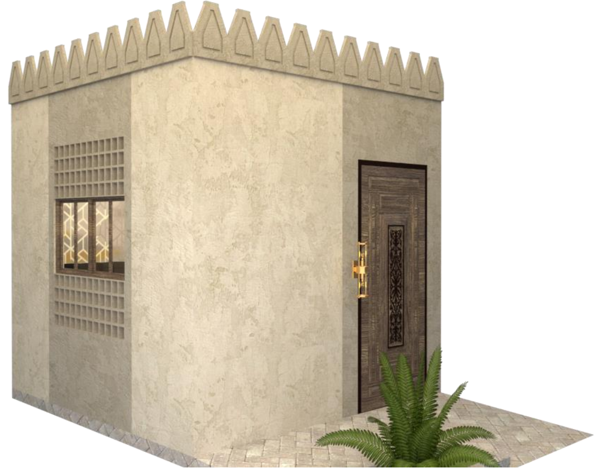
منظور لواجهات النموذج