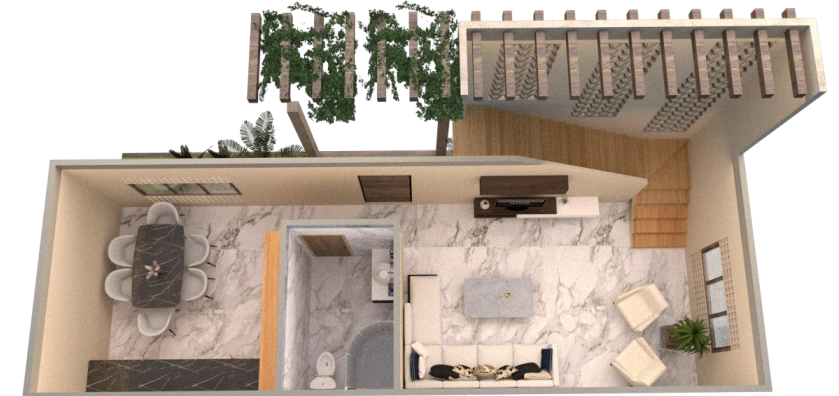
مسقط الدور الارضى