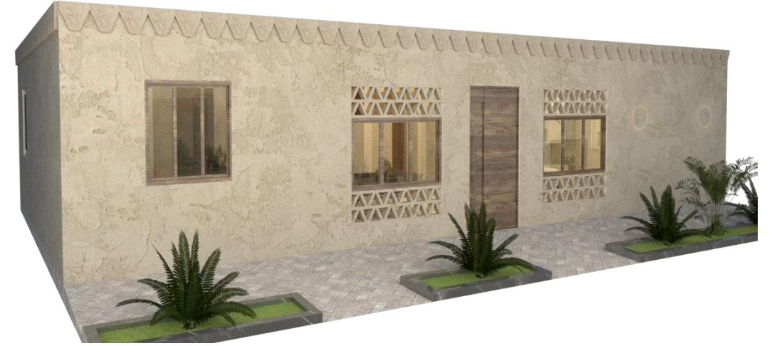
منظور لواجهات النموذج