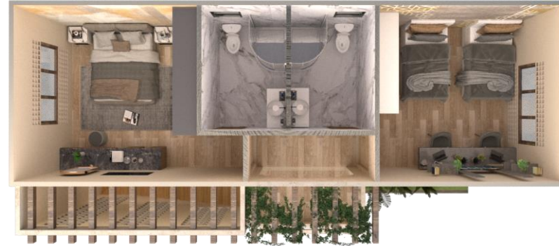
مسقط الدور الاول