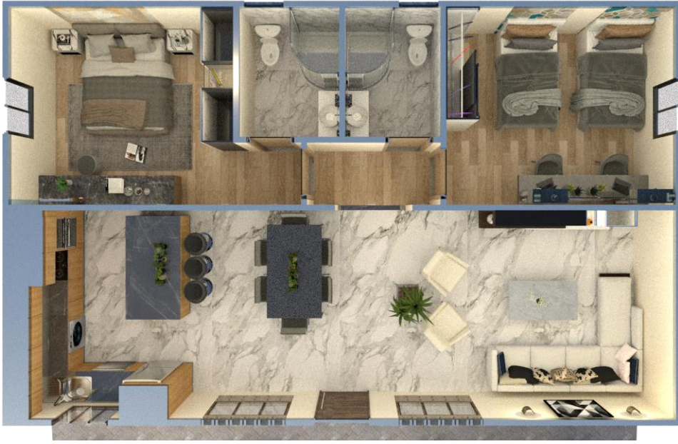
مسقط افقى للنموذج

يتكون النموذج من استقبال ومعيشة وسفرة ومطبخ امريكي وغرفة نوم رئيسية ملحق بها حمام خاص وغرفة نوم اخرى وحمام