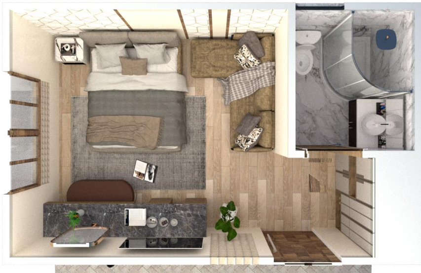
مسقط افقى للنموذج