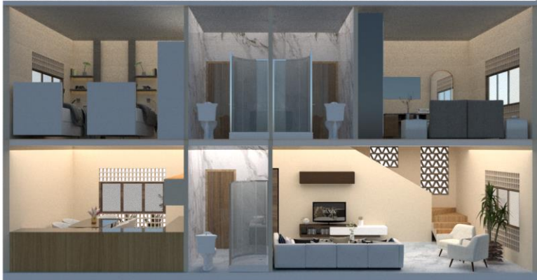
قطاع منظورى للنموذج