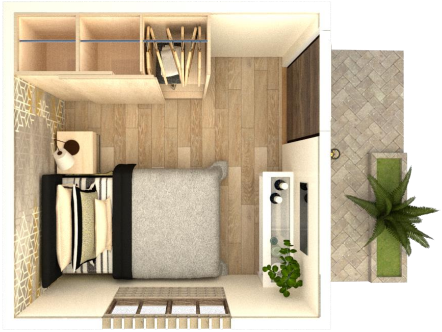
مسقط افقى للنموذج