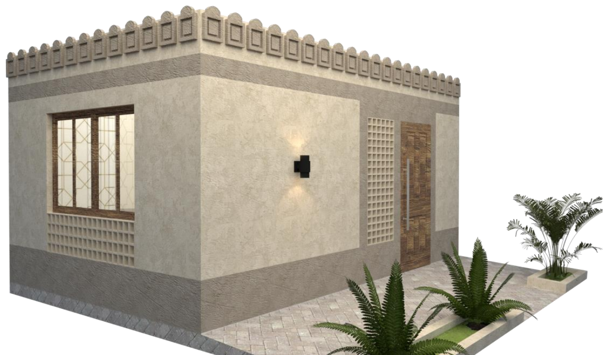
منظور لواجهات النموذج