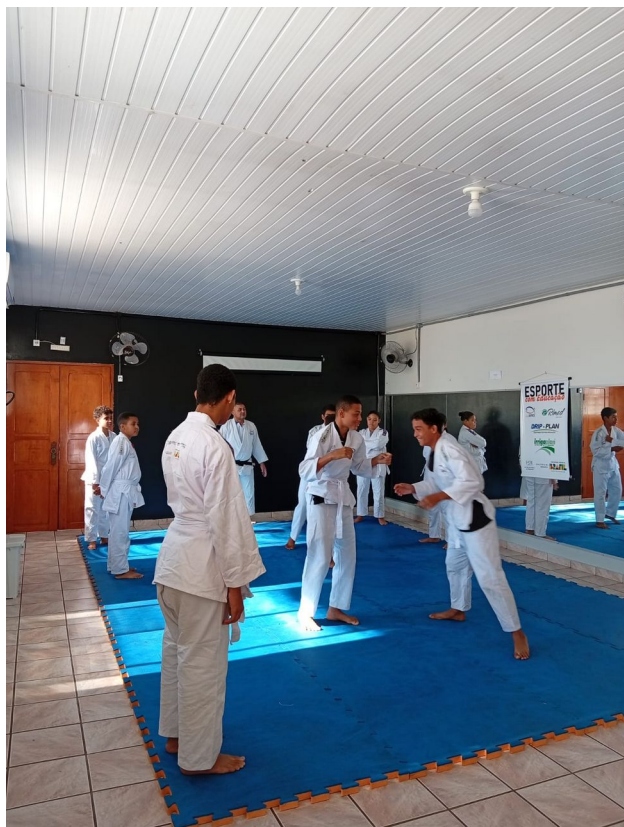
Oficina de Judô