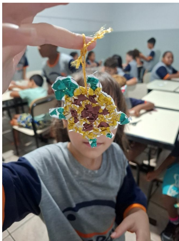
Oficina de Artes