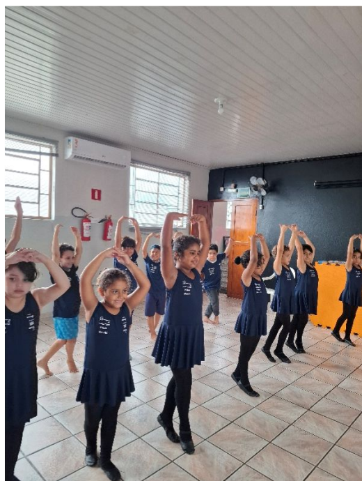
Oficina de Ballet