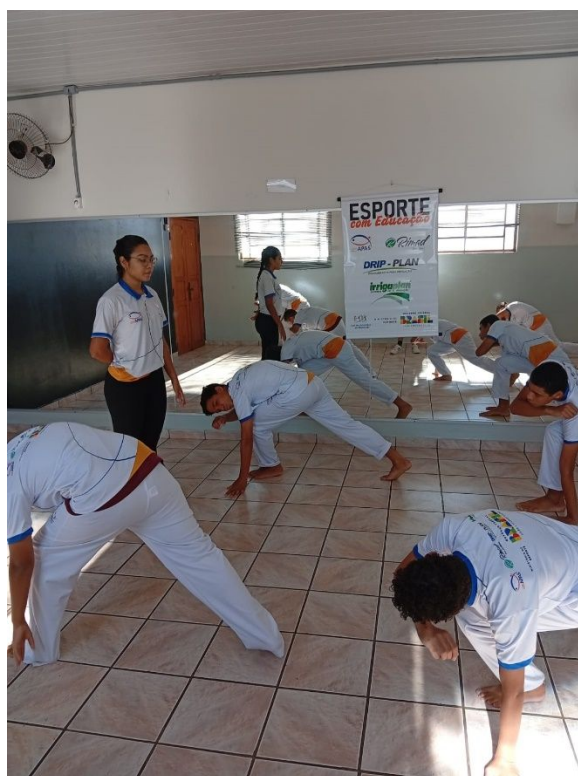
Oficina de Capoeira