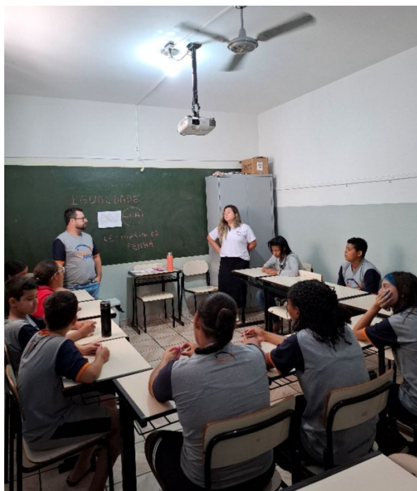
GRUPO SOCIO EDUCATIVO