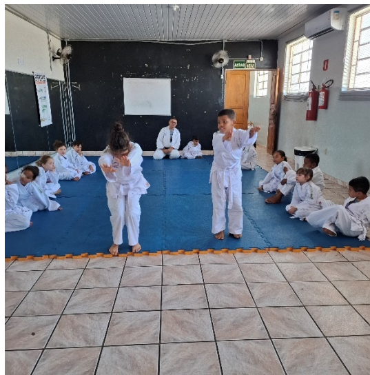
Oficina de Judô