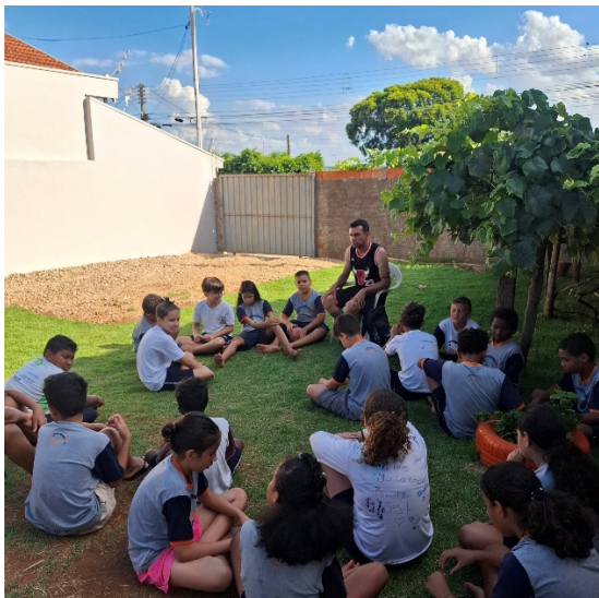
Oficina de Recreação