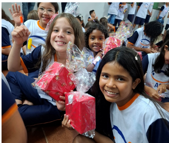
ENTREGA DE PRESENTES