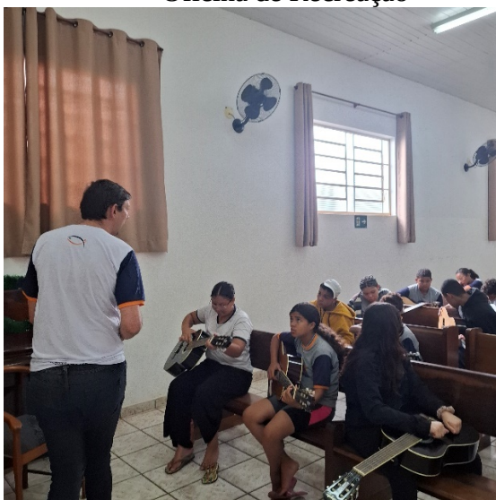
Oficina de Música