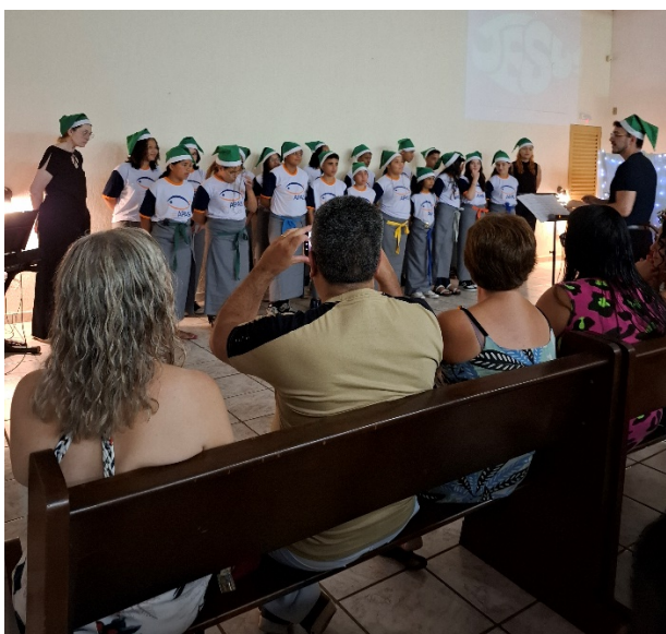
APRESENTAÇÃO CORAL MINAZ