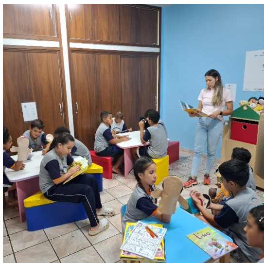
Oficina de Tertúlia Literária