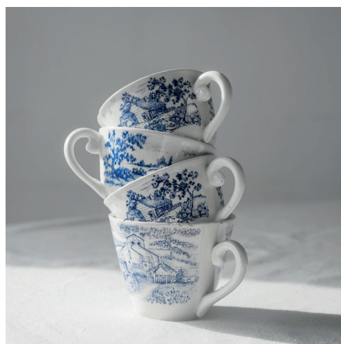
tasses anglaises motif paysage ou fleuri, bleu sur blanc