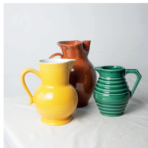
pichets colorés formes et contenances variables