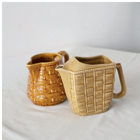
pichets barbotine en forme de fruit ou de panier