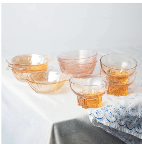
coupelles roses dépareillées, formes, détails et teintes variables