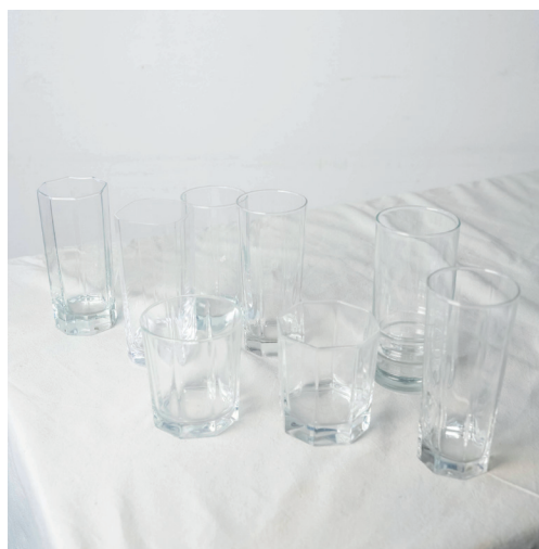
verres transparents dépareillés, long drink ou gobelet, formes diverses et variées