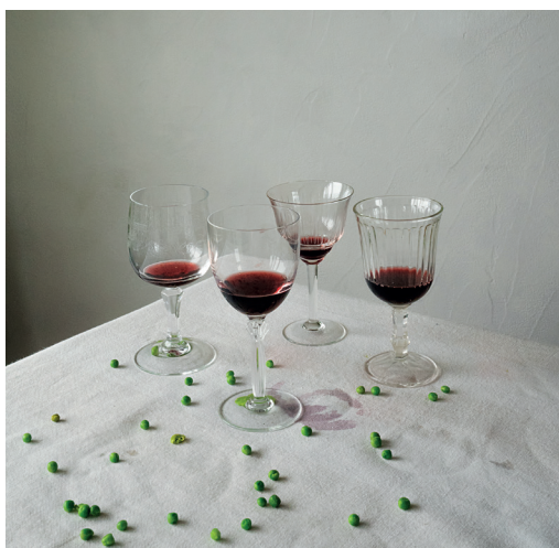
verres à vin transparents dépareillés, gravés ou ciselés, formes diverses et variées