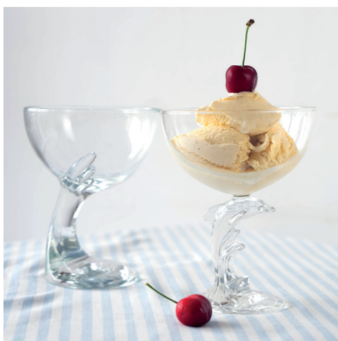
coupes à glace transparentes diverses formes, pied dauphin ou plus sobre