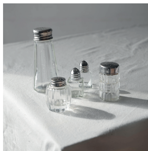
salières en verre plus ou moins grandes, simples et efficaces ou ciselées