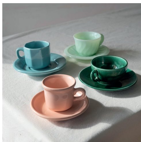
tasses colorées avec ou sans soucoupe, sélection camaieu ou arc en ciel selon les goûts