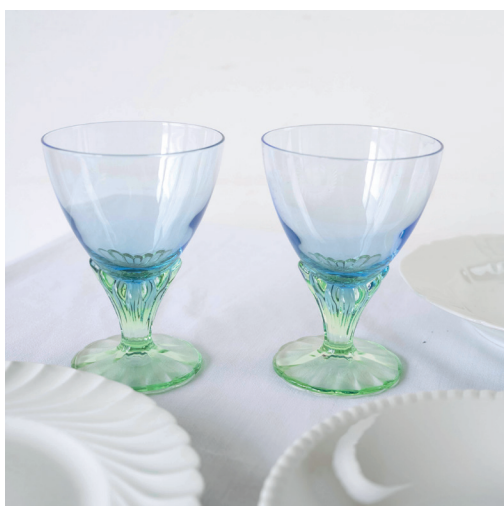
verres à eau Bormioli Rocco design vintage italien