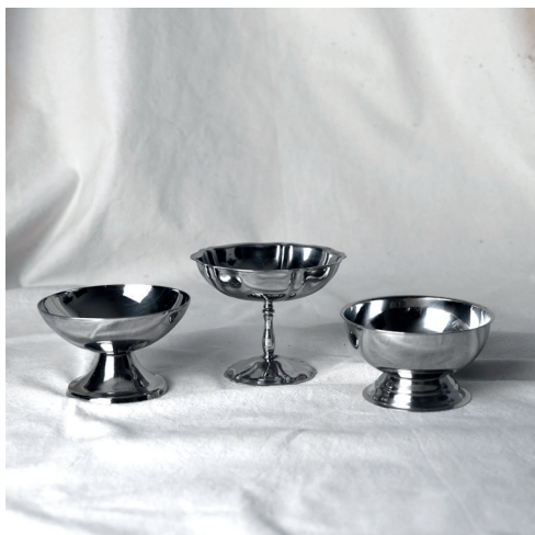
coupelles inox dépareillées, formes et détails divers