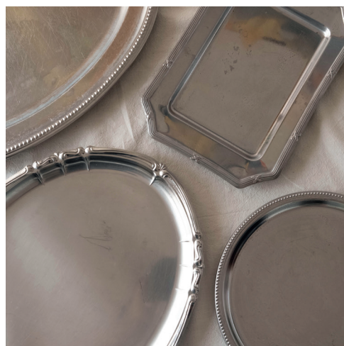
plateaux inox petit ou grand, rectangle, ovale ou rond, plus ou moins de détails