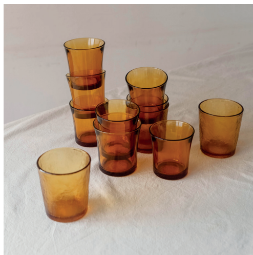
gobelets verres ambrés comme chez mamie