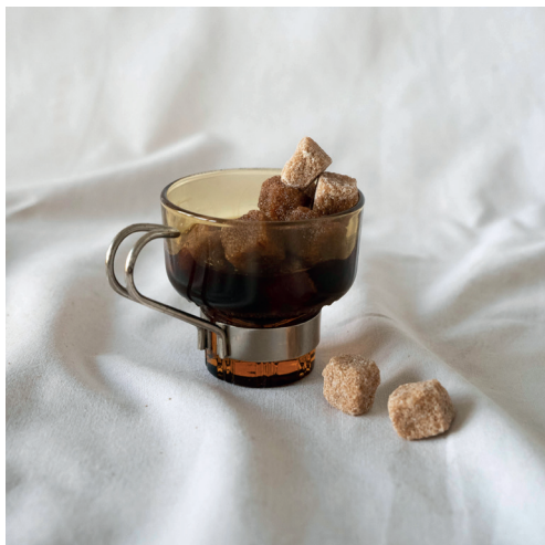
tasses à cafés ambrées et fumées avec ou sans soucoupes, avec ou sans anse métallique