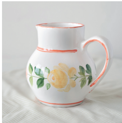
pichets peints à la main motifs floraux ou fruités, couleurs pastels