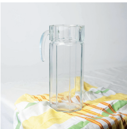
pichets transparents formes et contenances variables