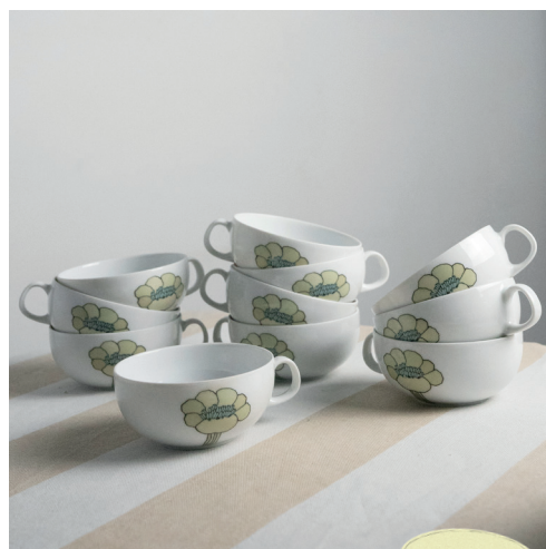
tasses à thé motif fleur x12 porcelaine, signée et numérotée, fabriqué en Allemagne dans les années 60/70