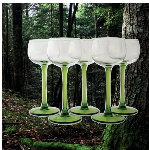
verres à vin d'Alsace pied vert, plus ou moins foncé