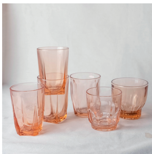
gobelets roses dépareillés, teintes et contenances légèrement variables