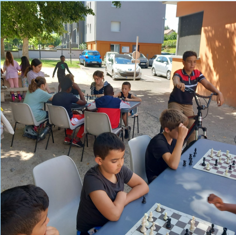
Quartier Mouysset TARBES