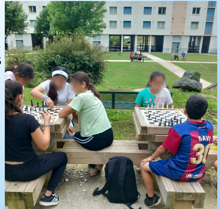
Quartier Ophite LOURDES