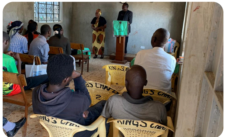
1. juni 2024, Kiambu trening lyser opp