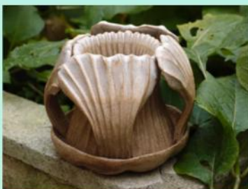
Claire Citroën. Benoîte aquatique, 2022 grès émaillé. 12 x 14 x 15 cm

Contact LA GALERIE A VENIR / Laura Tendil info.lagalerieavenir@gmail.com 06 58 62 77 58 lagalerieavenir.com