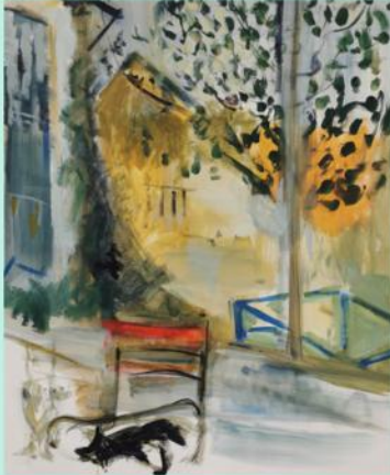
Isabelle Geoffroy-Dechaume "Le chat", 2023 colle et pigments sur toile. 146 x 114 cm