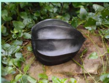
Claire Citroën. "Physalis", 2023 bronze (fonderie Susse). 15 x 18 x 15 cm