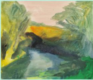
Isabelle Geoffroy-Dechaume "Vue de rivière", 2023 colle et pigments sur toile. 38 x 46 cm