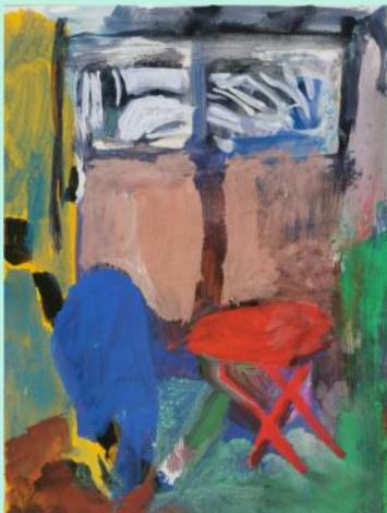
Isabelle Geoffroy-Dechaume "Vue d'atelier guéridon rouge". Colle et pigments sur papier. 45 x 35 cm