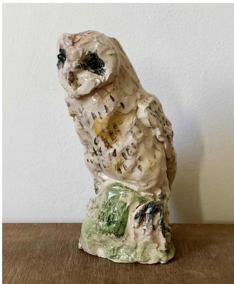
Chouette Effraie , 2023