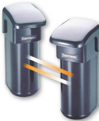
Détecteur de passage infrarouge

La détection de présence peut aussi se faire au moyen d'un appareil dédié au signalement du passage d'un intrus entre deux capteurs reliés par un rayon lumineux invisible à l'œil nu : c'est le principe du détecteur de passage , ou barrière infrarouge, utilisé couramment dans les boutiques ou les magasins pour signaler l'entrée ou la sortie d'un client.