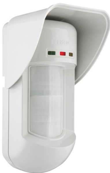
Détecteur volumétrique (détecteur de mouvements)

Les systèmes modernes reposent sur de petits appareils que sont les détecteurs de présence. Ces appareils sont conçus pour mesurer et signaler une activité dans une zone précise. On distingue généralement les détecteurs volumétriques , basés par exemple sur l'analyse des mouvements, et les détecteurs périmétriques , chargés de surveiller les événements qui surviennent au niveau des issues.