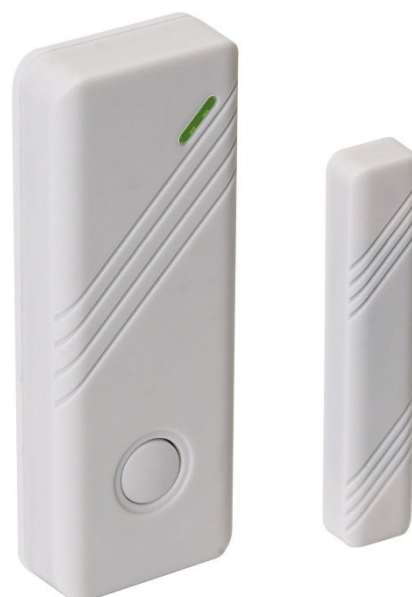
Détecteur périmétrique (détecteur d'ouverture)