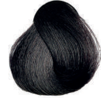
3 CASTANO SCURO Dark brown

Châtain foncé, Castaño oscuro, Καστανό σκούρο Ciemy kasztan, Tmavá hnědá, Темно-каштановый کستنائی غامق