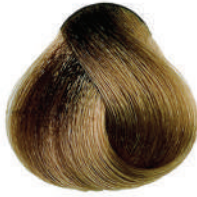
8.13 SABBIA CENERE Ash sand

Sable cendré, Arena ceniza, Σαχτί άμμος Popielaty piasek, Písková popelavá, Пепельно-песочный رمادى رملي