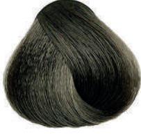
5.01 CASTANO CHIARO FREDDO Cold light brown

Châtain clair froide, Castaño claro frío, Καστανό ανοιχτό ψυχρό Jasny zimny kasztan, Světla hnědá studená, Холодный светло-каштановый, بني فاتح بارد