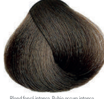
6.0 BIONDO SCURO INTENSO Intense dark blond

Blond foncé intense, Rubio oscuro intenso Έντονο ξανθό σκούρο, Ciemy intensywny mblond Tmavá blond intenzivní, Интенсивный темный блондин اشقر غامق مركز