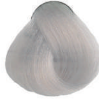
901S ULT.SUPERSCH. CENERE Ult. ash superlight.

Ult. super éclaircissant cendré, Ult. superclar. ceniza Έξτρα υπερκαθαυτό σαχτί, Ult. superroz. popielaty Ult. superzsvětlující popelavá, Ультра суперосветлитель пепельный اشقر رمادى لامع جدا