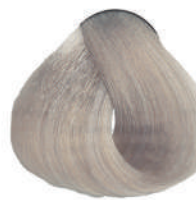
912 SUPERSCHIAR. ARGENTO Silver superlight.

Super éclaircissant argent, Superclarante plata Υπερκαθαυτό ασημί, Superrozjaśniacz srebrzysty Superzsvětlující stříbrná, Суперосветлитель серебряный اشقر فضي لامع