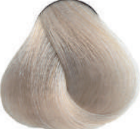
10.1 BIONDISSIMO CENERE Lightest ash blond

Blond clair clair cendré, Rubio superclaro ceniza Κατόξανθο φυσικό σταχτί, Super jasny popielaty blond, Super světlá blond popelavá, Супер светлопепельный блондин, اشقر رمادي ثلجي