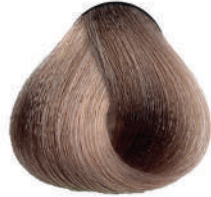
8.7 BIONDO CHIARO SABBIA Light sand blond

Blond clair sable, Rubio claro arena, Ξανθό ανοιχτό της άμμου Jasny piaskowy blond, Světlá blond písková Светло-песочный блондин, اشقر رملي فاتح