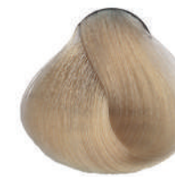
903 SUPERSCHIAR. DORATO Golden superlight.

Super éclaircissant doré, Superclarante dorado Υπερκαθαυτό χρυσάφι, Superrozjaśniacz złocisty Superzsvětlující zlatá, Суперосветлитель золотистый اشقر ذهبي لامع