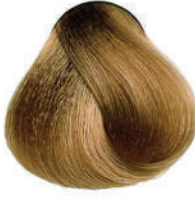
8.31 SABBIA DORATA Golden sand

Sable doré, Arena dorada, Χρυσάφι άμμος Złocisty piasek, Písková zlatá, Песочно-золотистый ذهبي رملي