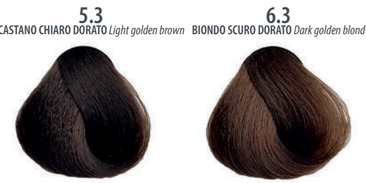
5.3 CASTANO CHIARO DORATO Light golden brown Châtain clair doré, Castaño claro dorado, Καστανό ανοιχτό χρυσαφί, Jasný złocisty kasztan, Světlá hnědá zlatá Светло-золотисто-каштановый, بنی ذهبی فاتح 6.3 BIONDO SCURO DORATO Dark golden blond Blond foncé doré, Rubio oscuro dorado, Ξανθό σκούρο χρυσαφί Cierny złocisty blond, Tmavá blond zlatá Золотистый темный блондин, اشقر ذهبی غامق