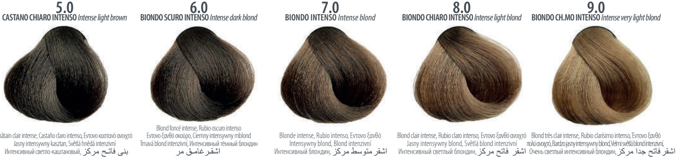
5.0 CASTANO CHIARO INTENSO Intense light brown