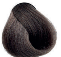
7.1 BIONDO CENERE Ash blond

Blond cendré, Rubio ceniza, Ξανθό σταχτί, Popielaty blond, Blond popelavá, Пепельный блондин اشقر رمادي متوسط