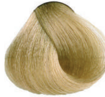
10.13 BIONDISSIMO LIME Lightest lime blond

Blond clair clair lime, Rubio superclaro lime, Κατάλευθο λιμέ Super jasny cytrynowy blond, Super světlá blond limeta اشقر فاتح خفيف, Очень светлый блондин лайм