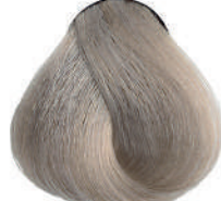
9.1 BIONDO CH.MO CENERE Very light ash blond

Blond très clair cendré, Rubio clarísimo ceniza Ξανθό πολύ ανοιχτό σταχτί, Bardzo jasny popielaty blond, Velmi světlá blond popelavá, Очень светлый пепельный блондин, اشقر رمادي فاتح جدا