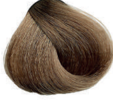
8.0 BIONDO CHIARO INTENSO Intense light blond

Blond clair intense, Rubio claro intenso, Έντονο ξανθό ανοιχτό Jasny intensywny blond, Světla blond intenzivní Интенсивный светлый блондин, اشقر فاتح مركز