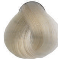
900S ULT.SUPERSCH. NATURALE Ult. natural superlight.

Ult. super éclaircissant naturel, Ult. superclar. natural Έξτρα υπερκαθαυτό φυσικό, Ult. superroz. naturalny Ult. superzsvětlující přírodní, Ультра суперосветлитель натуральный اشقر طبيعي لامع جدا