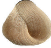
9 BIONDO CHIARISSIMO Very light blond

Blond très clair, Rubio clarísimo, Ξανθό πολύ ανοιχτό Bardzo jasny blond, Velmi světlá blond, Очень светлый блондин اشقر فاتح جدا