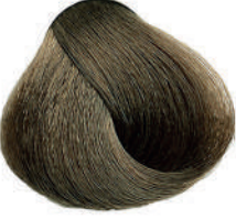
7.01 BIONDO FREDDO Cold blond

Blond froide, Rubio frío, Ξανθό ψυχρό Zimny blond, Blond studená, Холодный блондин اشقر بارد