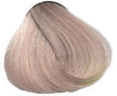
10.7 BIONDISSIMO SABBIA Lightest sand blond

Blond clair clair sable, Rubio superclaro arena, Κατάλευθο της άμμου Super jasny piaskowy blond, Super světlá blond písková اشقر رملي تلجى, Очень светло-песочный блондин