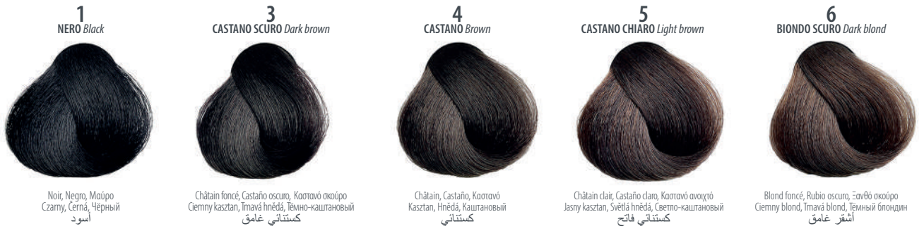
1 NERO Black

Noir, Negro, Μαύρο Czarny, Černá, Черный أسود