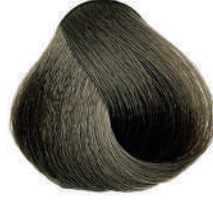
6.01 BIONDO SCURO FREDDO Cold dark blond

Blond foncé froide, Rubio oscuro frío, Ξανθό σκούρο ψυχρό Ciemy zimny blond, Tmavá blond studená, Холодный темный блондин, اشقر غامق بارد