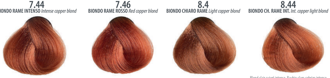
7.44 BIONDO RAME INTENSO Intense copper blond Blond cuivré intense, Rubio cobrizo intenso, Έντονο Ξανθό χαλκίνο Miedziany intensywny blond, Blond měděná intenzivní Интенсивный медный блондин, اشقر نحاسی مرکز