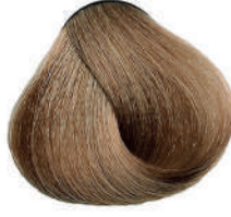
8 BIONDO CHIARO Light blond

Blond clair, Rubio claro, Ξανθό ανοιχτό Jasny blond, Světla blond, Светлый блондин اشقر فاتح