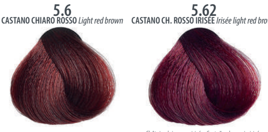
5.6 CASTANO CHIARO ROSSO Light red brown Châtain clair rouge, Castaño claro rojo, Καστανό ανοιχτό κόκκινο Jasny czerwony kasztan, Světlá hnědá červená Светло-красный каштановый, بنی محمر فاتح 5.62 CASTANO CH. ROSSO IRISÉE Irisée light red brown Châtain clair rouge irisée, Castaño claro rojo irisée Καστανό ανοιχτό κόκκινο ίρις, Jasný czerwono-fioletowy kasztan Světlá hnědá červená fialová, Светло-каштановый красный ирис, بنی محمر فاتح ایریس