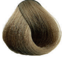
8.01 BIONDO CHIARO FREDDO Cold light blond

Blond clair froide, Rubio claro frío, Ξανθό ανοιχτό ψυχρό, Jasny zimny blond, Světla blond studená, Холодный светлый блондин اشقر فاتح بارد