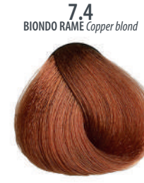
7.4 BIONDO RAME Copper blond Blond cuivré, Rubio cobrizo, Ξανθό χαλκίνο Miedziany blond, Blond měděná, Медный блондин اشقر نحاسی