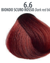
6.6 BIONDO SCURO ROSSO Dark red blond Blond foncé rouge, Rubio oscuro rojo, Ξανθό σκούρο κόκκινο Cierny czerwony blond, Tmavá blond červená Красный темный блондин, اشقر غامق محمر