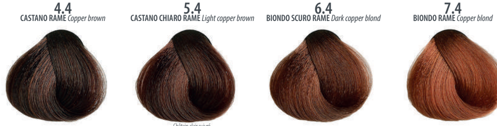
4.4 CASTANO RAME Copper brown Châtain cuivré, Castaño cobrizo, Καστανό χαλκίνο Miedziany kasztan, Hnědá měděná Медно-каштановый, بنی نحاسی