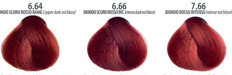
6.64 BIONDO SCURO ROSSO RAME Copper dark red blond Blond foncé rouge cuivré, Rubio oscuro rojo cobrizo Ξανθό σκούρο κόκκινο χαλκίνο, Cierny czerwono miedziany blond Tmavá blond červená měděná, Темный красно-медный блондин اشقر نحاسی غامق محمر