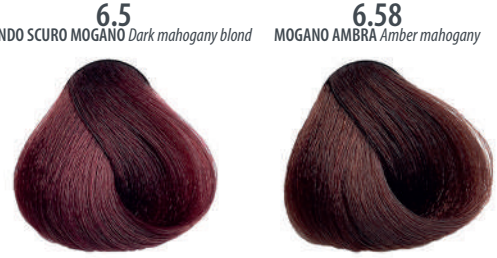
6.5 BIONDO SCURO MOGANO Dark mahogany blond Blond foncé acajou, Rubio oscuro caoba, Ξανθό σκούρο μαύρι Cierny mahoniowy blond, Tmavá blond mahagonová Темный блондин махагон, اشقر فاتح ماهوچنی 6.58 MOGANO AMBRA Amber mahogany Acajou ambre, Caoba ámbar, Κυρσιπύρι μαύρι Cierny mahoniowy mahori, Mahagonová jantarová Махагон янтарный, ماهوچنی عنبر