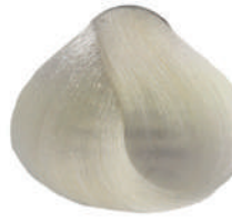
1000 RINFORZATORE DI SCHIAR. Bleaching booster

Renforceur d'éclaircissement, Reforzador de decoloración Белоточко 강화제, Wzmocniacz rozjaśnienia Posilovač zsvětlení, Ближний бустер, تفتيح