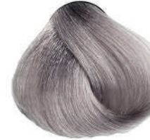
10.11 BIONDISSIMO CENERE INT. Int. ash lightest blond

Blond clair clair cendré intense, Rubio superclaro ceniza intenso, Κατόξανθο πλατινέ σταχτί έντονο, Intensywnie popielaty super jasny blond, Super světlá blond popelavá intenzivní, Интенсивный пепельный супер светлый блондин اشقر رمادي ثلجي مركز