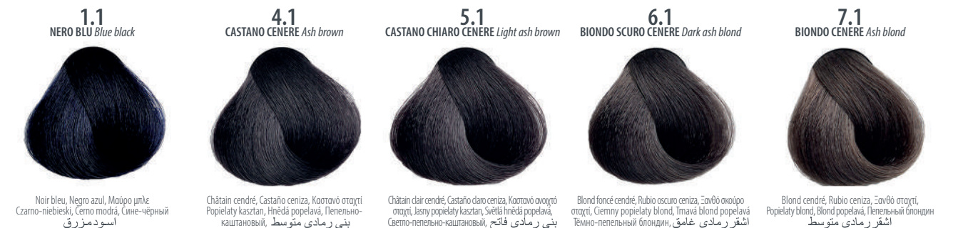
1.1 NERO BLU Blue black