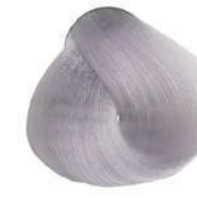
902S ULT.SUPERSCH. IRISÉE Ult. irisée superlight.

Ult. super éclaircissant irisée, Ult. superclar. irizado Έξτρα υπερκαθαυτό ιριζέ, Ult. superroz. fioletowy Ult. superzsvětlující fialová, Ультра суперосветлитель перламутр ايريس لامع جدا