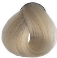
900 SUPERSCHIAR. NATURALE Natural superlight.

Super éclaircissant naturel, Superclarante natural Υπερκαθαυτό φυσικό, Superrozjaśniacz naturalny Superzsvětlující přírodní, Суперосветлитель натуральный اشقر طبيعي لامع