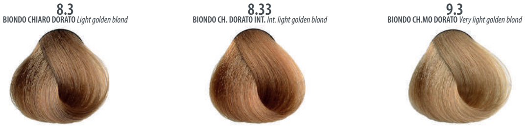
8.3 BIONDO CHIARO DORATO Light golden blond Blond clair doré, Rubio claro dorado, Ξανθό ανοιχτό χρυσαφί Jasny złocisty blond, Světlá blond zlatá Золотистый светлый блондин, اشقر ذهبی فاتح