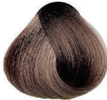
7.7 BIONDO SABBIA Sand blond

Blond sable, Rubio arena, Ξανθό της άμμου Piaskowy blond, Blond písková, Песочный блондин اشقر رملي