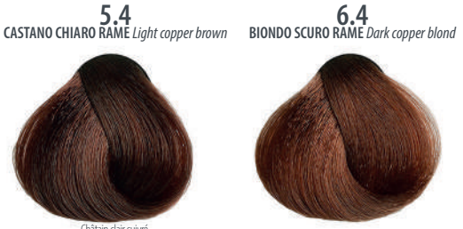
5.4 CASTANO CHIARO RAME Light copper brown Châtain clair cuivré, Castaño claro cobrizo, Καστανό ανοιχτό χαλκίνο Jasny miedziany kasztan, Světlá hnědá měděná Светлый меднокаштановый, بنی نحاسی فاتح 6.4 BIONDO SCURO RAME Dark copper blond Blond foncé cuivré, Rubio oscuro cobrizo, Ξανθό σκούρο χαλκίνο Cierny miedziany blond, Tmavá blond měděná Темно-медный блондин, اشقر نحاسی غامق