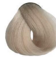
913 SUPERSCHIAR. BEIGE Beige superlight.

Super éclaircissant beige, Superclarante beige Υπερκαθαυτό μπεζ, Superrozjaśniacz beżowy Superzsvětlující béžová, Суперосветлитель бежевый اشقر بيج لامع