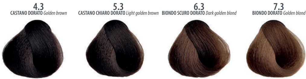
4.3 CASTANO DORATO Golden brown Châtain doré, Castaño dorado, Καστανό χρυσαφί Złocisty kasztan, Hnědá zlatá, Золотисто каштановый بنی ذهبی