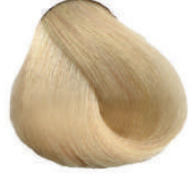
10 BIONDO PLATINO Lightest platinum blond

Blond clair clair platine, Rubio superclaro platinado, Κατόξανθο στο χρώμα της πλατινής, Super blond platynowy, Super světlá blond platynová, اشقر فاتح جدا بلاتيني, Супер светлый платиновый блондин