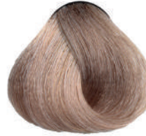
9.7 BIONDO CH.MO SABBIA Very light sand blond

Blond très clair sable, Rubio clarísimo arena Ξανθό πολύ ανοιχτό της άμμου, Bardzo jasny piaskowy blond, Velmi světlá blond písková