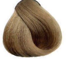
9.0 BIONDO CH.MO INTENSO Intense very light blond

Blond très clair intense, Rubio clarísimo intenso, Έντονο ξανθό πολύ ανοιχτό, Bardzo jasny intensywny blond, Velmi světlá blond intenzivní, Очень светлый платиновый блондин, اشقر فاتح جدا مركز