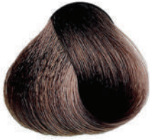
6.7 BIONDO SCURO SABBIA Dark sand blond

Blond foncé sable, Rubio oscuro arena, Ξανθό σκούρο της άμμου Ciemny piaskowy blond, Imáva blond písková темно-песочный блондин, اشقر رملي غامق