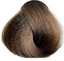
7 BIONDO Blond

Blond, Rubio, Ξανθό Blond, Blond, Блондин اشقر