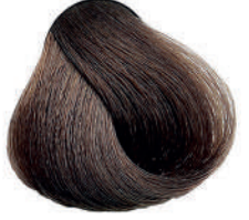
6 BIONDO SCURO Dark blond

Blond foncé, Rubio oscuro, Ξανθό σκούρο Ciemy blond, Tmavá blond, Темный блондин اشقر غامق