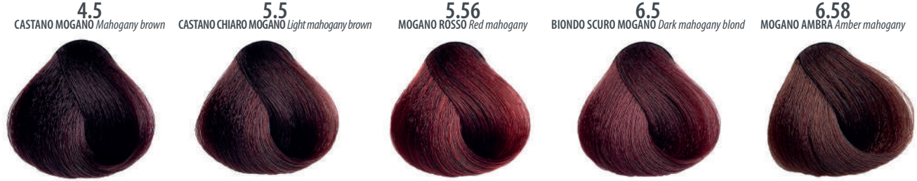
4.5 CASTANO MOGANO Mahogany brown Châtain acajou, Castaño caoba, Καστανό μαύρι Mahoniowy kasztan, Hnědá mahagonová, Каштановый махагон بنی ماهوچنی