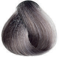
9.11 BIONDO CH.MO CENERE INT. Int. ash very light blond

Blond très clair cendré intense, Rubio clarísimo ceniza intenso, Κατόξανθο πολύ ανοιχτό σταχτί έντονο, Intensywnie popielaty bardzo jasny blond, Velmi světlá blond popelavá intenzivní, Интенсивный пепельный очень светлый блондин اشقر رمادي فاتح جدا مركز