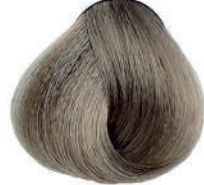
8.1 BIONDO CHIARO CENERE Light ash blond

Blond clair cendré, Rubio claro ceniza, Ξανθό ανοιχτό σταχτί Jasny popielaty blond, Světla blond popelavá, Пепельный светлый блондин, اشقر رمادي فاتح