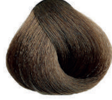
7.0 BIONDO INTENSO Intense blond

Blonde intense, Rubio intenso, Έντονο ξανθό Intensywny blond, Blond intenzivní اشقر متوسط مركز