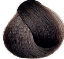
5 CASTANO CHIARO Light brown

Châtain clair, Castaño claro, Καστανό ανοιχτό Jasny kasztan, Světla hnědá, Светло-каштановый کستنائی فاتح