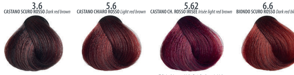
3.6 CASTANO SCURO ROSSO Dark red brown Châtain foncé rouge, Castaño oscuro rojo, Καστανό σκούρο κόκκινο Czerwono ciemny brąz, Tmavá hnědá červená Красный темно-каштановый, بنی محمر غامق