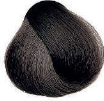
4 CASTANO Brown

Châtain, Castaño, Καστανό Kasztan, Hnědá, Каштановый کستنائی