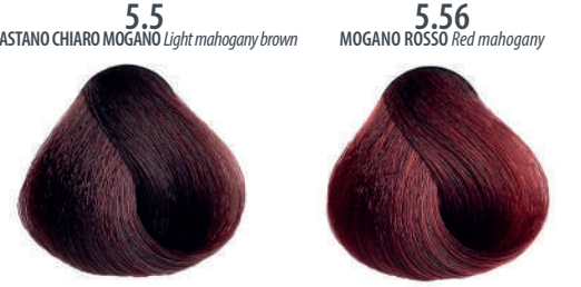
5.5 CASTANO CHIARO MOGANO Light mahogany brown Châtain clair acajou, Castaño claro caoba, Ανοιχτό καστανό μαύρι Jasny mahoniowy kasztan, Světlá hnědá mahagonová Светло-каштановый махагон, بنی ماهوچنی فاتح 5.56 MOGANO ROSSO Red mahogany Acajou rouge, Caoba rojo, Κόκκινο μαύρι Czerwony mahoni, Mahagonová červená, Красный махагон احمر ماهوچنی