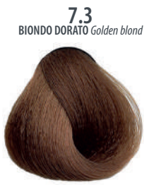
7.3 BIONDO DORATO Golden blond Blond doré, Rubio dorado, Ξανθό χρυσαφί Złocisty blond, Blond zlatá, Золотистый блондин اشقر ذهبی