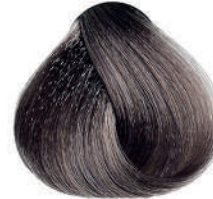
8.11 BIONDO CH. CENERE INT. Intense ash light blond

Blond clair cendré intense, Rubio claro ceniza intenso Ξανθό ανοιχτό σταχτί έντονο, Intensywnie popielaty jasny blond, Světla blond popelavá intenzivní, Интенсивный пепельный светлый блондин اشقر رمادي فاتح مركز