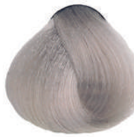
901 SUPERSCHIAR. CENERE Ash superlight.

Super éclaircissant cendré, Superclarante ceniza Υπερκαθαυτό σαχτί, Superrozjaśniacz popielaty Superzsvětlující popelavá, Суперосветлитель пепельный اشقر رمادى لامع