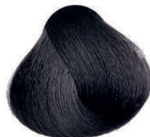
4.1 CASTANO CENERE Ash brown

Châtain cendré, Castaño ceniza, Καστανό σταχτί Popielaty kasztan, Hnědá popelavá, Пепельно- каштановый, بني رمادي متوسط