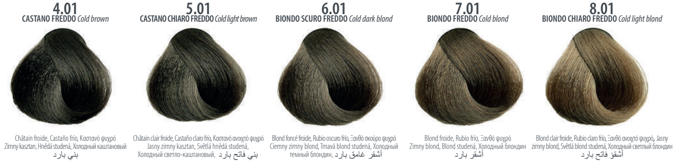
4.01 CASTANO FREDDO Cold brown