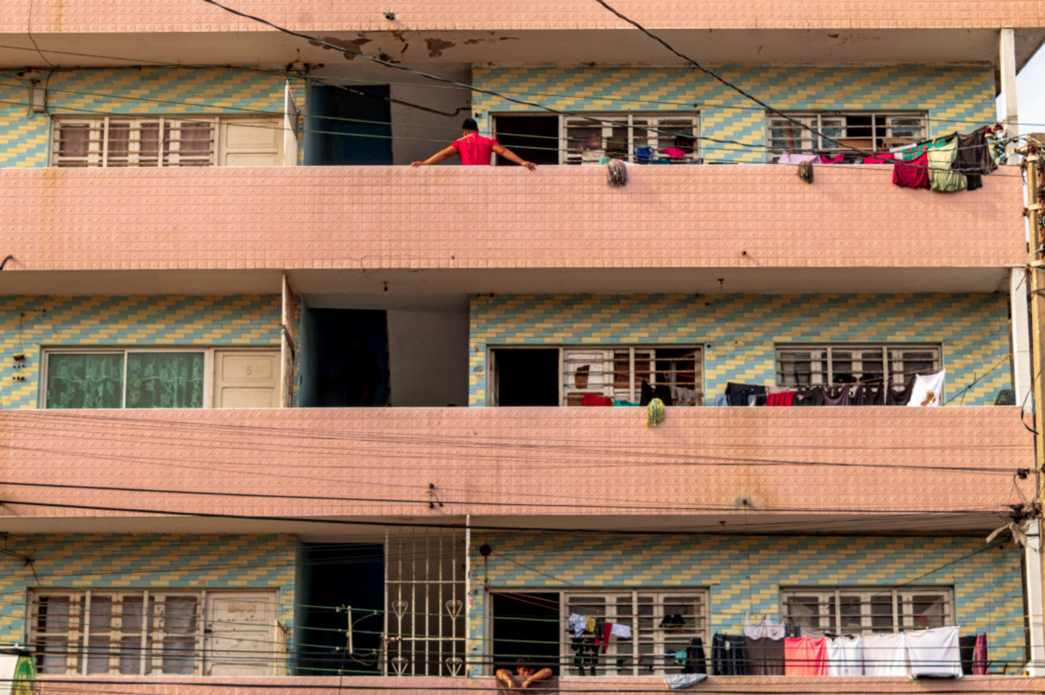
Veracruz, mi casa (trabajo en progreso). Roberto Vinicio Rebolledo Segura.