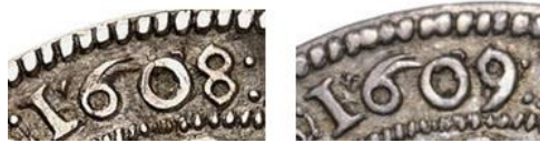
3. ábra: Eredeti és átmetszett évszámok az I. és I'. típusú hátlapi verőtöveken