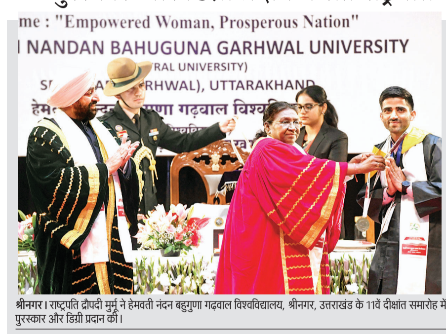
श्रीनगर। राष्ट्रपति द्रौपदी मुर्मू ने हेमवती नंदन बहुगुणा गढ़वाल विश्वविद्यालय, श्रीनगर, उत्तराखंड के 11वें दीक्षांत समारोह में पुरस्कार और डिग्री प्रदान कीं।