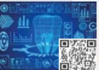
CPDs/Workshops Stream 14 Digital Dentistry & AI