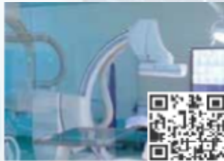
CPDs/Workshops Stream 11 Digitally & AI Enabled Regenerative Medicine