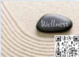
CPDs/Workshops Stream 05 Digital Mental Health