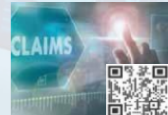
CPDs/Workshops Stream 16 Digitally & AI Enabled Healthcare Insurance