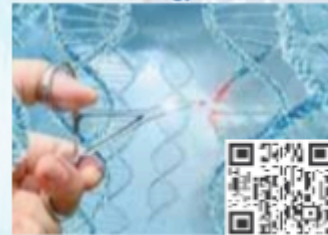
CPDs/Workshops Stream 07 Clinical Bioinformatics