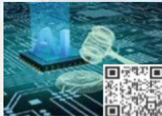
CPDs/Workshops Stream 15 AI & Digital Health Law