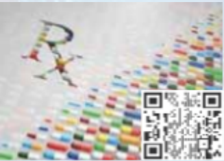
CPDs/Workshops Stream 09 Digital Pharmacovigilance & AI