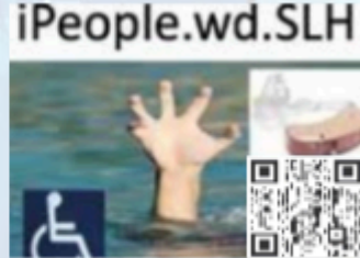
CPDs/Workshops Stream 06 AI & Digitally Enabled People with Disabilities