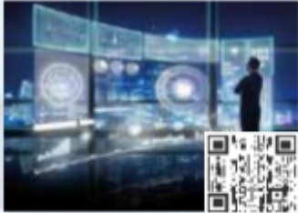
CPDs/Workshops Stream 01 Digital Health Transformation & AI