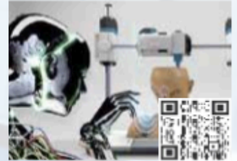
CPDs/Workshops Stream 04 Robotics Assisted Surgery