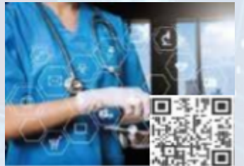
CPDs/Workshops Stream 12 Digital Nursing & AI