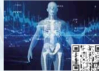
CPDs/Workshops Stream 03 Digital Radiology & AI