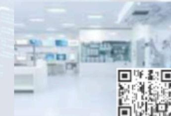
CPDs/Workshops Stream 08 Pharmacy Automation & AI