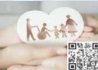
CPDs/Workshops Stream 13 Digitally & AI Enabled Public Health