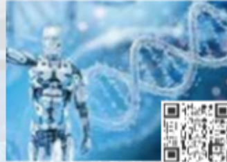
CPDs/Workshops Stream 02 Digital Pathology & AI