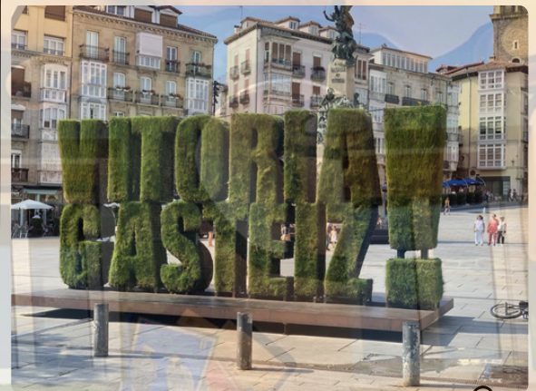
Plaza de la Virgen Blanca