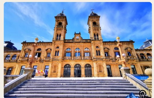
Vista del Ayuntamiento, San Sebastián