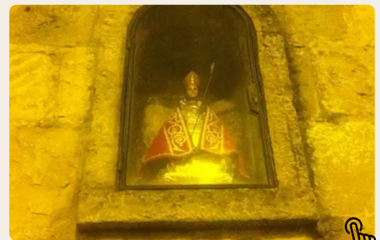
Estatua de San Fermín