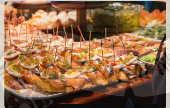
Pintxos: patrimonio de la gastronomía vasca