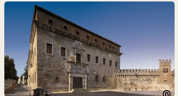
Palacio Escoriaza-Esquível. Siglo XVI.