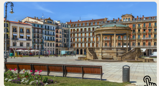
Plaza del Castillo