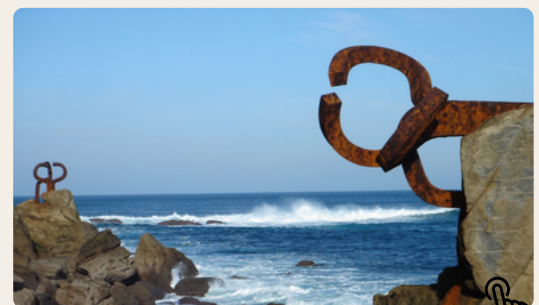
El Peine del Viento, Eduardo Chillida