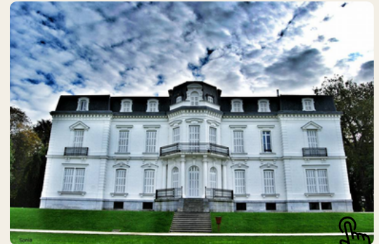
Palacio de Aiete

Regreso a Vitoria-Gasteiz, a las 20:30h, en autobús de línea.