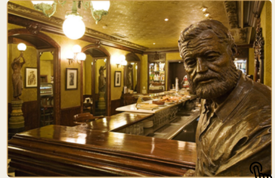
Estatua a Hemingway, en el Café Iruña.

Regreso a Vitoria-Gasteiz, a las 18:30h, en autobús de línea.