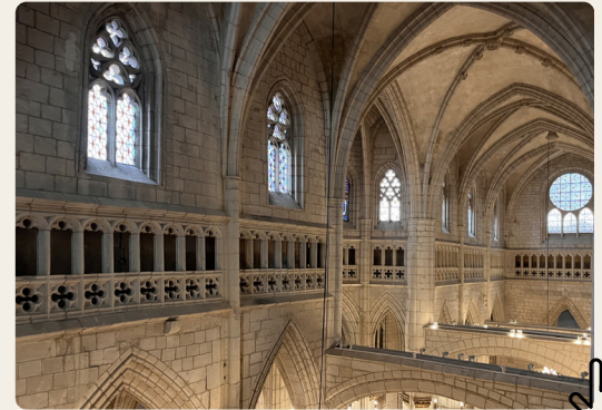
Catedral de Santa María (Catedral Vieja). S. XIII