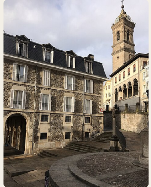
Torre San Vidente