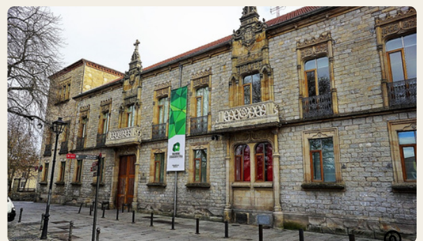
Palacio de Montehermoso. Siglo XVI (1524) Edificio de estilo gótico-renacentista.