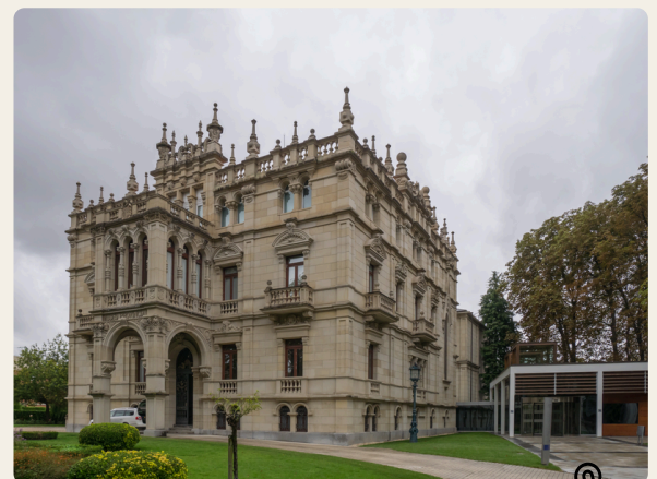
Museo de Bellas Artes de Álava