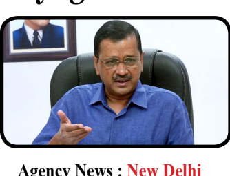
Agency News : New Delhi

Sunvilla News: Ahmedabad During its weekly meeting on Thursday, the standing committee of the Amdavad Municipal Corporation (AMC) instructed officials to eliminate encroachments along both banks of the Sabarmati riverfront. Councillors raised concerns that individuals had unlawfully demolished boundary walls at various locations to create unauthorised pathways. It has also been learned that some people are illegally collecting parking fees from visitors. The standing committee has asked the officials to take appropriate action and ensure regular monitoring of the area to prevent the recurrence of such incidents.