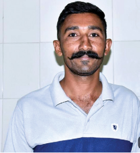
એજન્સી, સુરત, તા. ૨૬