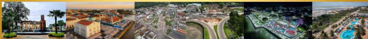
Ananindeua, Belém, Benevides, Marituba, Barcarena e Salinópolis

Esta não é uma recomendação de investimento, nem garantia de resultado financeiro