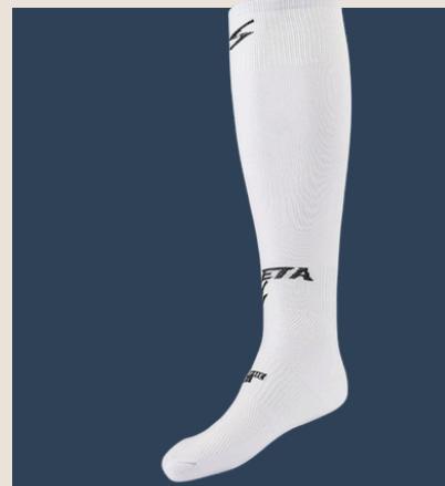
Medias de Futbol Profesional