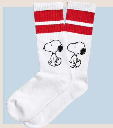
Calcetín con Elastico