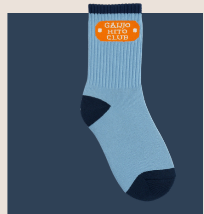
Medias con Toalla