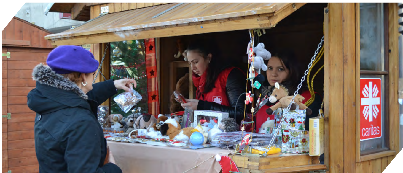
La Târgul Moșului cetățenii au ajutat nevoiașii prin cumpărături