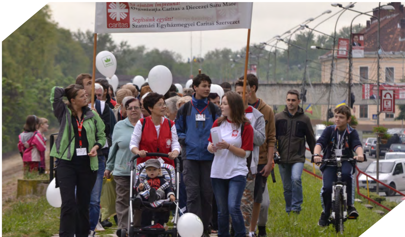
17 mai 2014 - Maraton de solidaritate pentru familiile nevoiașe, mai mult de 300 de participanți