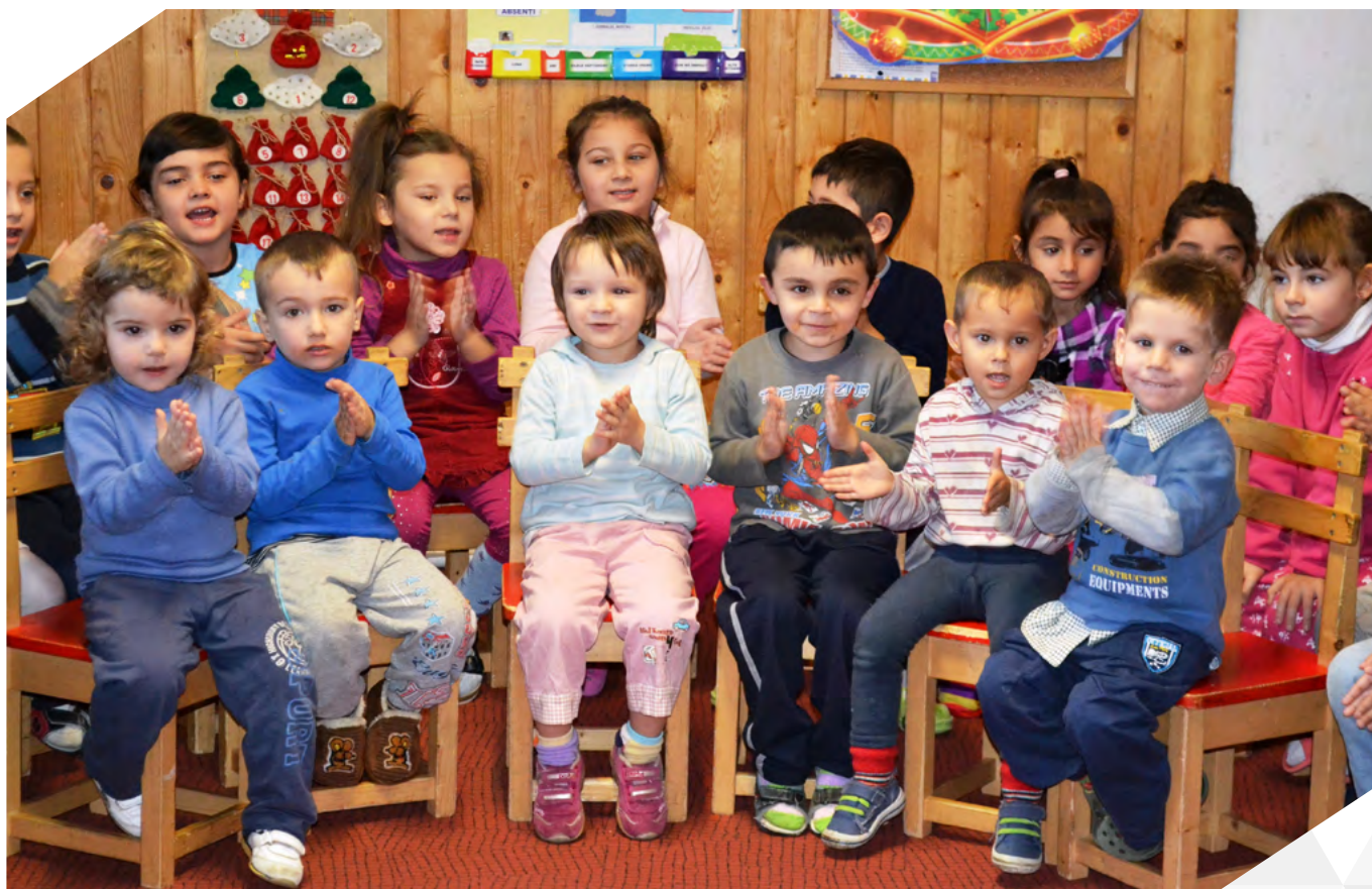
Programele comune aduc mereu zâmbete pe buzele copiilor