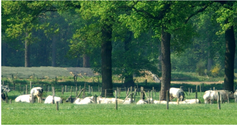
Afb. 29. Vertegenwoordigers van het Belgisch witblauwras.

september tot half februari, meen ik (tot voor kort was het één februari), mag je niet meer varen [= uitrijden]. Vroeger kon je al wat mest uitrijden, dat de grond kapot vroom van het stuk waar je aardappelen op ging poten; dat je vroeg fijn van tevoren het stuk kon cultivatoren [= met de cultivator bewerken] en dan was het landje klaar!