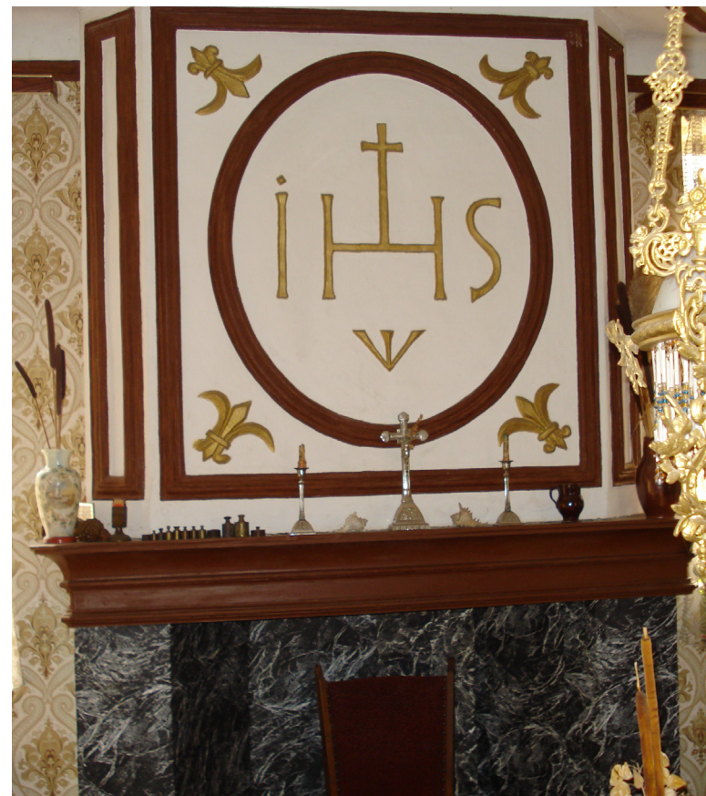
Afb. 3. Religieuze symboliek op de schouw in de abdissenkamer van de pachthoeve Munnichshof van het O.L. Vrouwe Munster in Roermond.