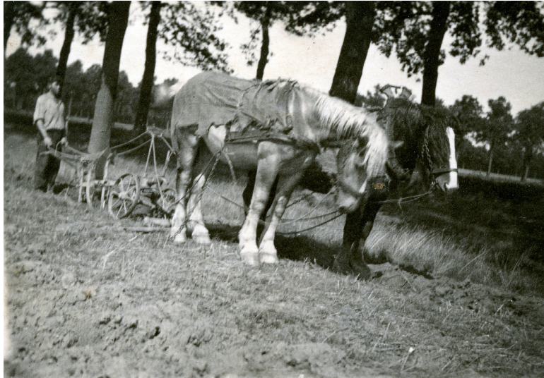
Afb. 7. Frits Peters aan het ploegen mer een eenscharige Prinz wentelploeg langs de middelste eikenlaan naar 't Reutje (Partic. Coll. ± 1925).

Voorts eene partij bijen met korven, eene hoeveelheid versche honi(n)g, eene vlasbraak, vlasreep, waspers en meer andere voorwerpen. 33