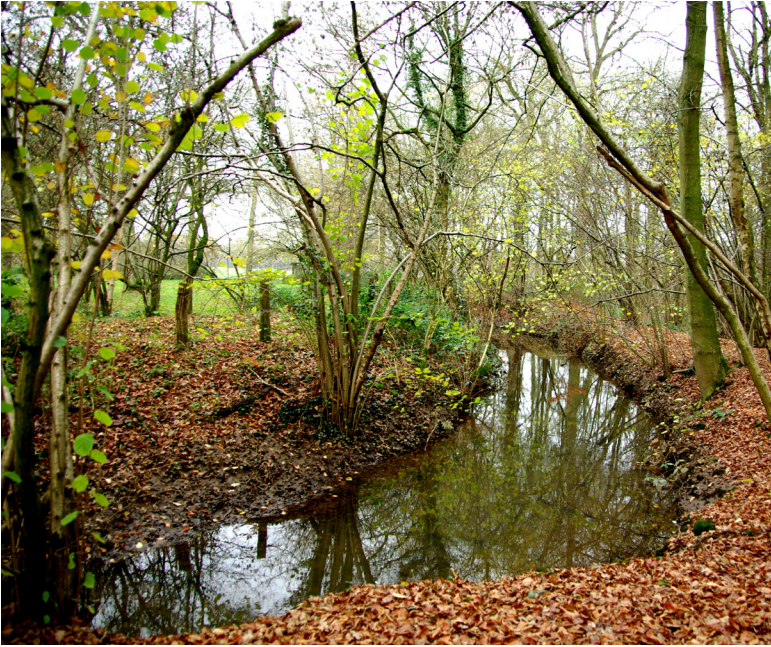
Afb. 2. De Vloot (-beek), of in het Limburgse dialect: 't Vloot in het Munnichsbos.

die van de bisschop van Utrecht de voogdij van Berg had gekregen, schonk de zusters daarop vrijstelling van belastingen. De originele oorkonde uit 1251 is verdwenen, maar er is wel een afschrift bewaard gebleven in een cartularium (register van afschriften van oorkonden). Boven in de marge van dat register is twee eeuwen later opgeschreven: 'curtis in Raetken', lees: 'de hof in 't Reutje'. En die aantekening biedt de sleutel om het aloude Suletheim te vinden, ook al moet die nederzetting al eeuwen geleden weer zijn verlaten en zijn verdwenen en ook al is de benaming Sultheim niet zonder meer identiek aan het Sweeltje , zoals een deel van het huidige Munnichsbos wordt genoemd. Ondanks deze haken en ogen moet de Munsterabdij na verwerving van het bos Engenhoven