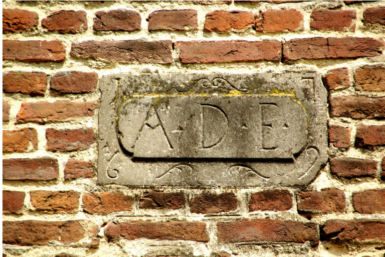
Afb. 5. Gevelsteen in de zijgevel van de grote schuur van Munnichshof (1769).

of zo zeer verkommerd dat nieuwbouw noodzakelijk werd? Anders dan hier en daar wordt gesuggereerd, heeft dit imposante economiegebouw nooit als tiendschuur dienst gedaan. Deze pachthoeve was (zoals we eerder hebben gezien) vrijgesteld van welke tienden dan ook, maar de graanschuur moest wel groot genoeg zijn om al het koren binnen te tassen en het 's winters op de din [= lemen dorsvloer] te dorsen. Bovendien bevond zich inpandig ook nog een grote schapenstal. Aan de zijgevel van deze schuur prijkt een gevelsteen met in het midden de letters A•D•E• ( Anno Domini Erectum / In het jaar des Heren opgericht) met daaromheen gegroeped de cijfers 1769.