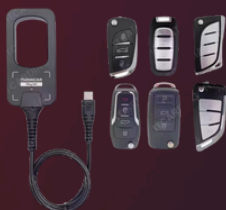
TK0082 THINKCAR TKey 101 Lesen & Schreiben Key