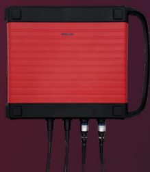
TK0035 ScopeBox 4 Kanal Oszilloskop 100 MHz