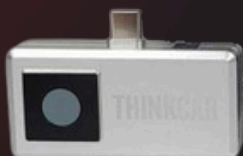
TK0341i THINKCAR PROG2 RF & IMMO TOOL