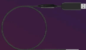
TK0032 USB Videokamera 150 cm Länge, 5,5 mm 6 LED, 1280 x 720 Auflösung