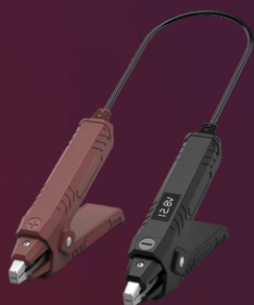
TK0031 ThinkEasy2 Anlasser- Batterie- Generatortester BT5.0