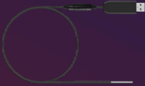
TK0032 USB Videokamera 150 cm Länge, 5,5 mm 6 LED, 1280 x 720 Auflösung