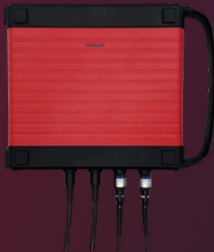
TK0035 ScopeBox 4 Kanal Oszilloskop 100 MHz