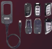
TK0082 THINKCAR TKey 101 Lesen & Schreiben Key