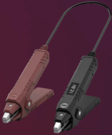
TK0031 ThinkEasy2 Anlasser- Batterie- Generatortester BT5.0