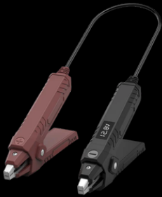
TK0031 ThinkEasy2 Anlasser- Batterie- Generatortester BT5.0