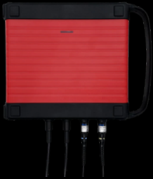
TK0035 ScopeBox 4 Kanal Oszilloskop 100 MHz