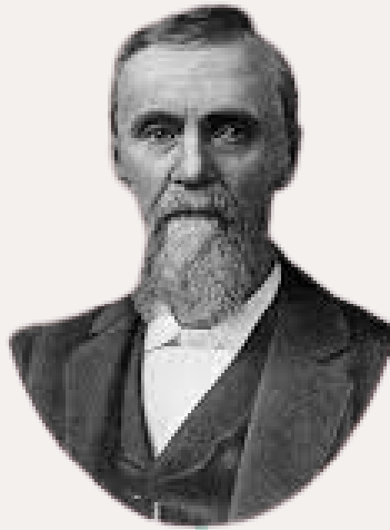
Andrew Taylor Still