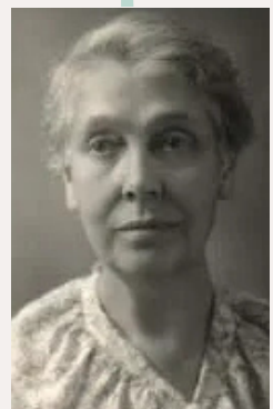
Louisa Burns circa 1903 Líder investigadora sobre los reflejos viscero-somáticos