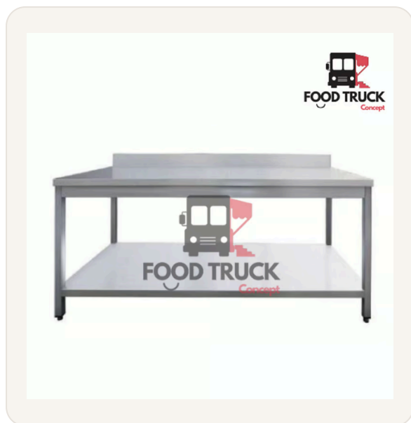
Table en acier inoxydable