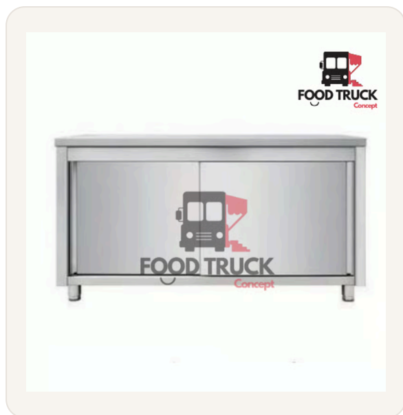
Table de travail inox (portes coulissantes)