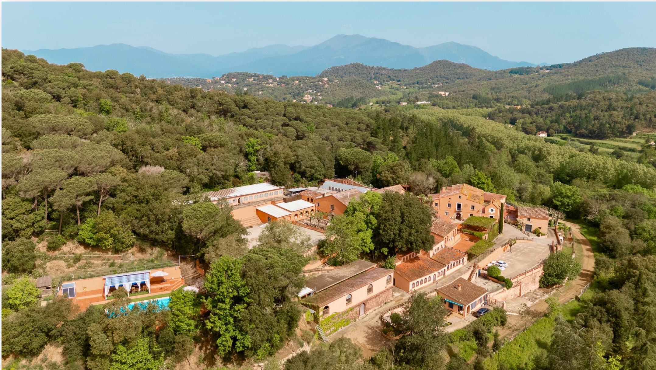
Наследие Антони Гауди в Монтнегре.