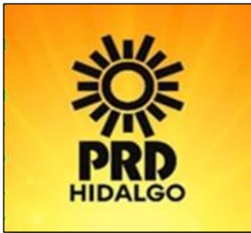
Tabla de Aplicabilidad de las Obligaciones de Transparencia Derivadas de la Ley General de Transparencia y Acceso a la Información Pública