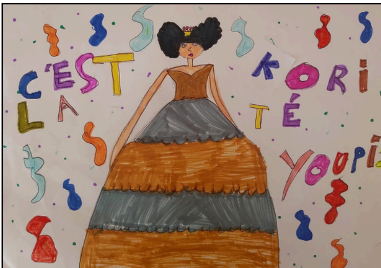
Aminata CISSE (CM1) - inspiration : Dewenatileen !