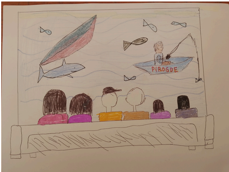
Khadija BREDJI (CE1) - inspiration : Film 'Océans' au cinéma