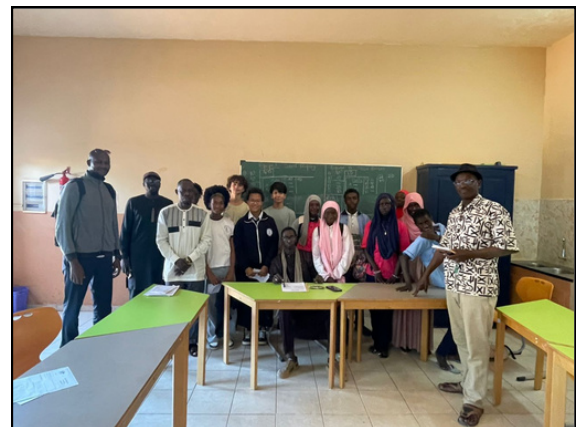
Dernière rencontre Génies en herbe