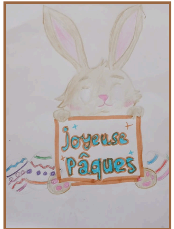
Delphine DIEDHIOU (5ème) - inspiration : fêtes de Pâques