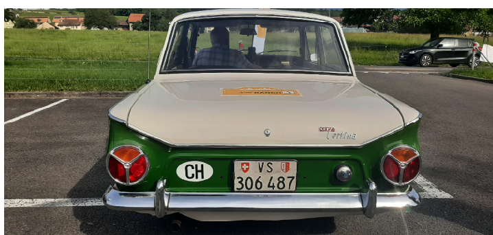
Cette 4ème Rando par Monts et par Vaux a réuni de jolies anciennes comme cette Lancia Delta Intégrale Evo 2 de 1994 ou cette Ford Cortina GT de 1966.