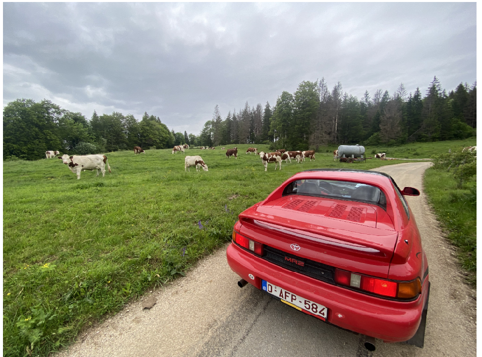
En altitude, au cœur des pâturages, en compagnie de vaches peu farouches...

Ets Benoît PINEUX Pompes injection Andenne