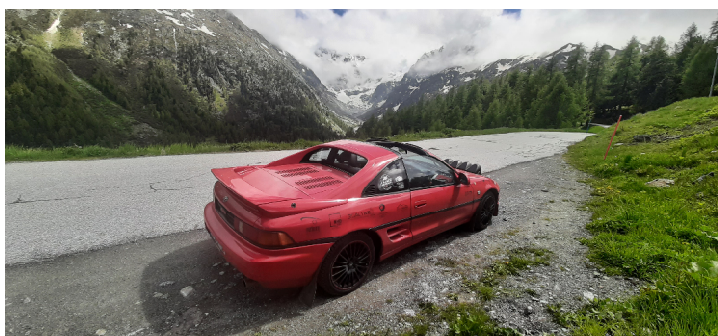
Impossible d'effectuer un si long déplacement sans en profiter pour emmener la MR2 en Gruyère (canton de Fribourg) ou face au glacier d'Arolla (canton du Valais). Que la Suisse est belle !