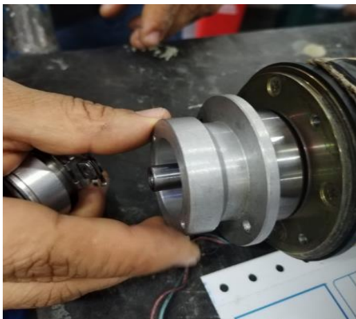
Fabricación y precisión