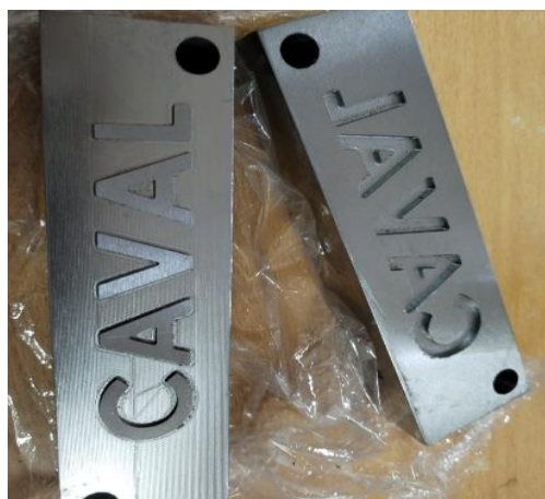
Fabricación de molde