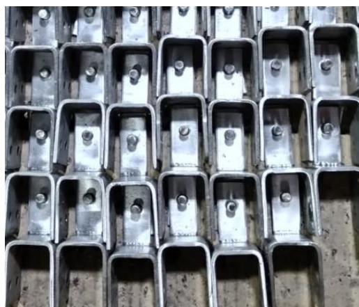
Fabricación de prototipos