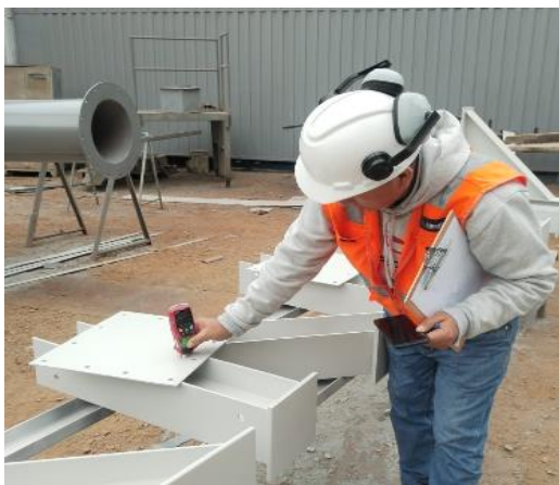
Fabricación y pintado de soporte