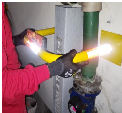
Fabricación de guarda