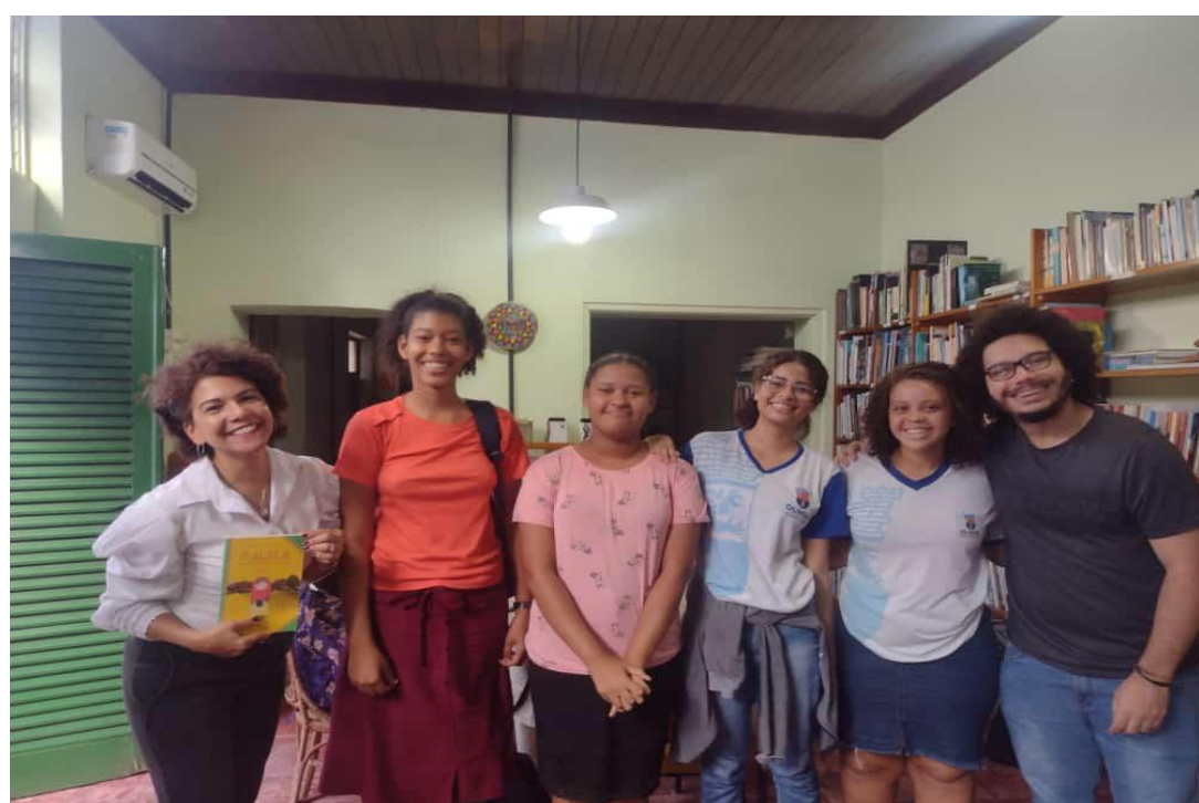
PESQUISA: CCLF- CENTRO DE CULTURA LUIZ FREIRE (@CENTROLUIZ.FREIRE)