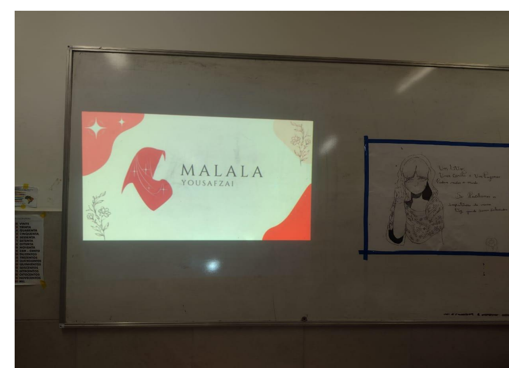
APRESENTAÇÃO PARA COMUNIDADE LOCAL (ALTO DA CONQUISTA - OLINDA):