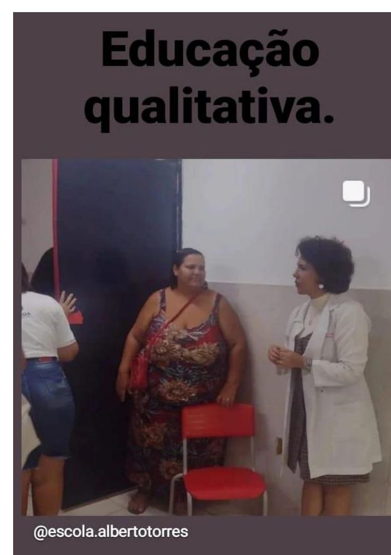
APRESENTAÇÃO NA ESCOLA PARA TODA A COMUNIDADE ESCOLAR: PAIS, PROFESSORES, ESTUDANTES