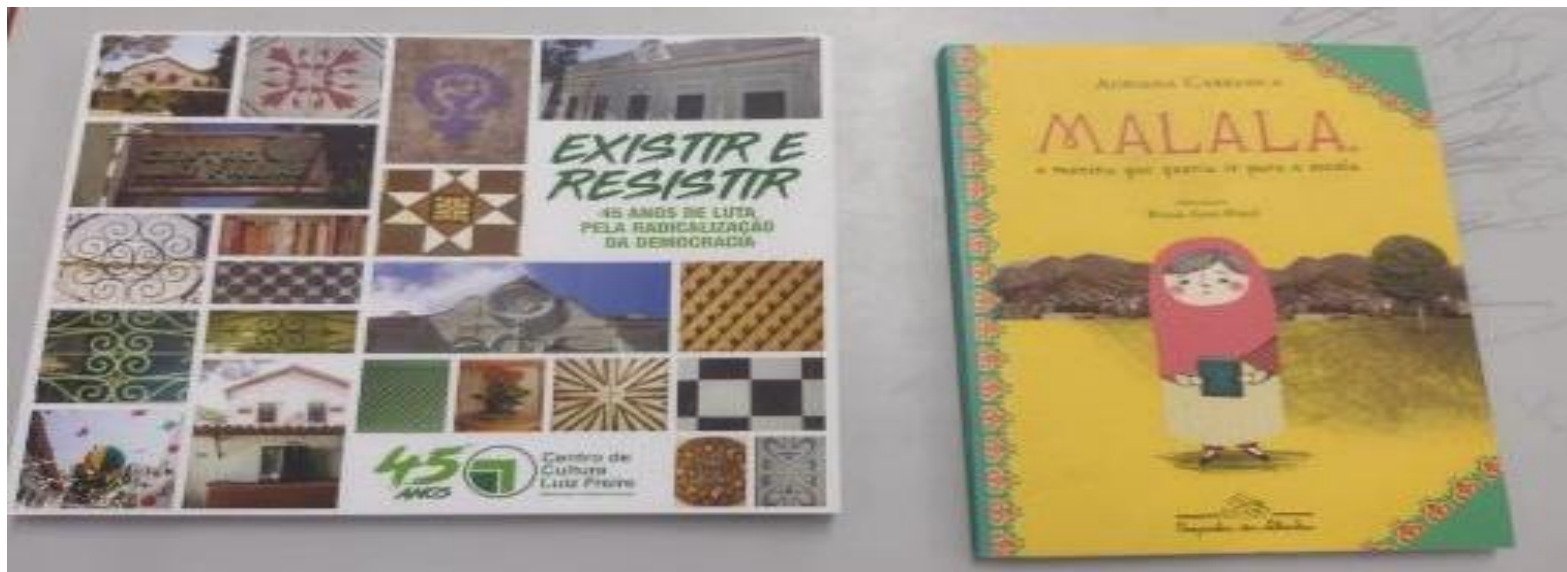
Bibliografias consultadas nas rodas de diálogo