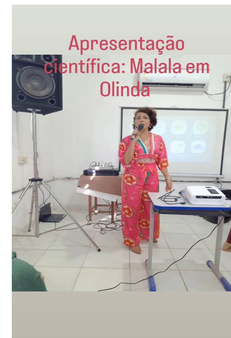
APRESENTAÇÃO NA ESCOLA MUNICIPAL MONSENHOR FABRÍCIO: (TROCA DE EXPERIÊNCIAS EXITOSAS DAS ESCOLAS INTEGRAIS EM OLINDA)