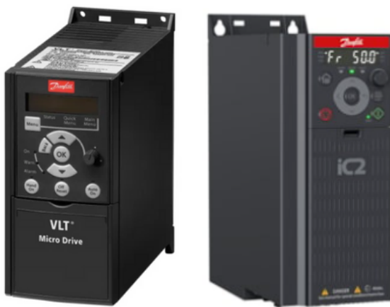
Serie Fc-51 / iC2-Micro