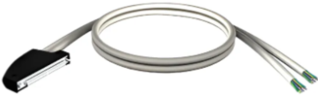
Cables Modicon (Schneider)