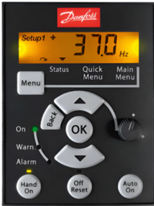
Paneles de Control