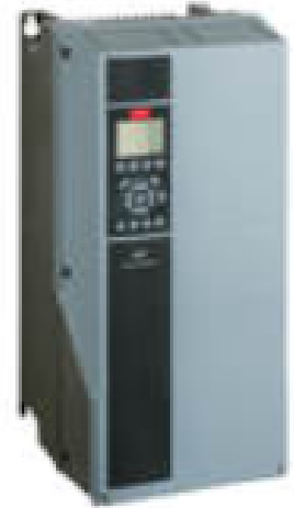
Serie VLT - 302

El iC2-Micro es la evolución del micro drive de Danfoss ( Fc-51 ), enfocado en máquinas estándar con mayores requerimientos de control, conectividad y eficiencia energética.