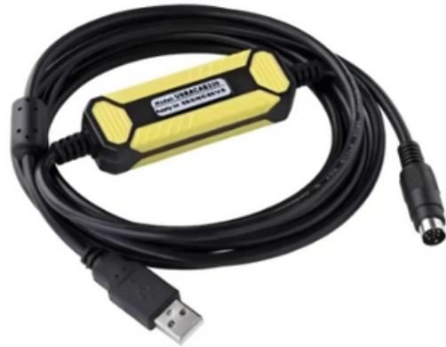
Cable Programador USB