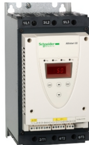
Arrancadores Suaves (Schneider/Peter Electronic)