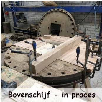
Bovenschijf - in proces

In Januari is de molenmaker verder gegaan, waar wij gestopt zijn. Verder demonteren en afvoeren van de onderdelen van de bovenschijf naar de werkplaats. Herstellen bovenplaat en enkele nieuwe staven. Vervolgens alle onderdelen naar de molen en naar de kap gehesen. Alles weer op de koningsspil gemonteerd en uitgelijnd met nieuwe wiggen. Ziet er