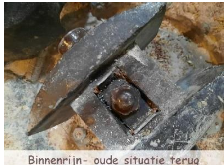
Binnenrijn- oude situatie terug

De lagering van de bolspil in de taatspot gaf steeds problemen. Het tonnetjes lager bleek niet geschikt te zijn. Het draagvermogen was te laag met gevolg dat het stuk draaide. Bij contacten met de leverancier is een tonnetjes lager gevonden met een draagvermogen dat ruimschoots geschikt is voor het maalkoppel. Gelukkig paste het lager goed. Zelfde diameter maar hoger. Gelukkig geen aanpassingen en de bolspil paste goed.