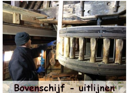
Bovenschijf - uitlijnen

weer piekfijn uit. Daarna de luitafel weer op zijn plek geplaatst en met enkele nieuwe wiggen uitgelijnd. Moest losgehaald worden om het demonteren van de bovenschijf mogelijk te maken, om de koningsspil ver genoeg te laten kantelen.