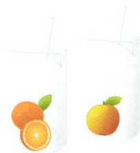
2dl de jus de fruits

ca. 6 sucres de raisin (le nombre de morceaux dépend du produit)