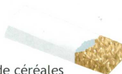
une barre de céréales