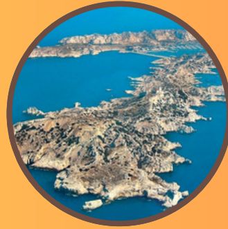
Les îles du Frioul et le Château d'If