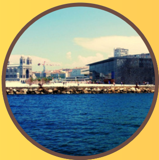
L'esplanade du J4