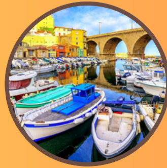
Vallon des Auffes