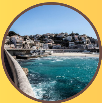
La Corniche Kennedy