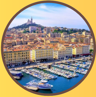
Le vieux port

Quelques lieux emblématiques de la cité phocéenne à découvrir lors de votre temps libre.