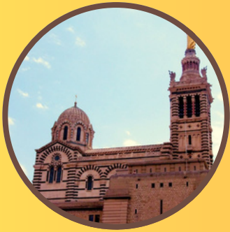
Notre Dame de la Garde