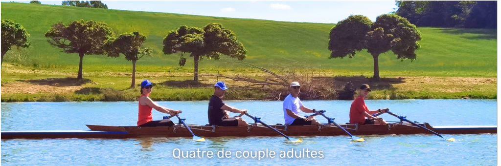
Quatre de couple adultes