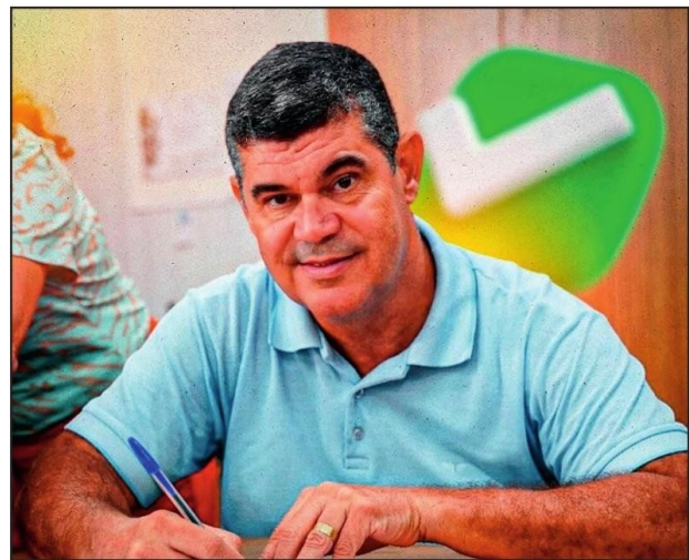
PREFEITO Nel cumpre legislação ao pagar o piso