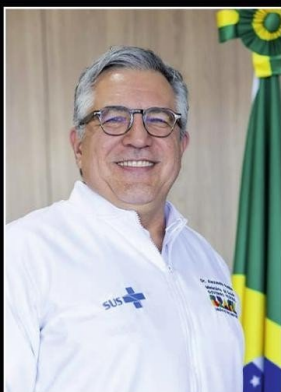
MINISTRO Alexandre Padilha