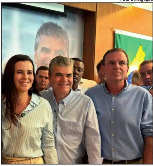
LÍDERES nacionais prestigiaram o evento no Rio