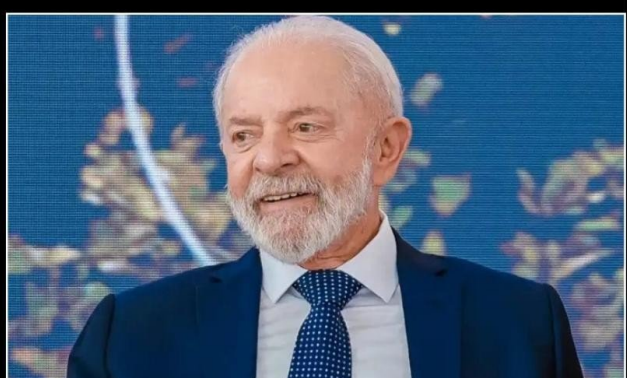
LULA condena os gastos com guerras, enquanto milhões de pessoas no mundo passam fome e continuam analfabetas

Em entrevista a CNN Internacional, o presidente Luiz Inácio Lula da Silva (PT/SP) defendeu uma agenda de paz no mundo que abranja um engajamento das nações mais ricas do planeta no combate à fome e à pobreza, às mudanças climáticas e na reforma das estruturas da governança global. "O mundo não pode continuar gastando US$ 2,4 trilhões com guerras e com conflitos, quando a gente deveria utilizar esse dinheiro para alfabetizar e alimentar milhões e milhões de pessoas que ainda passam fome e pessoas que são analfabetas no mundo"- enfatizou Lula, um retirante nordestino que enfrentou o "fantasma" da fome na infância.