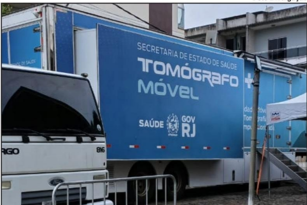
TOMÓGRAFO foi instalado ao lado do Centro Cultural