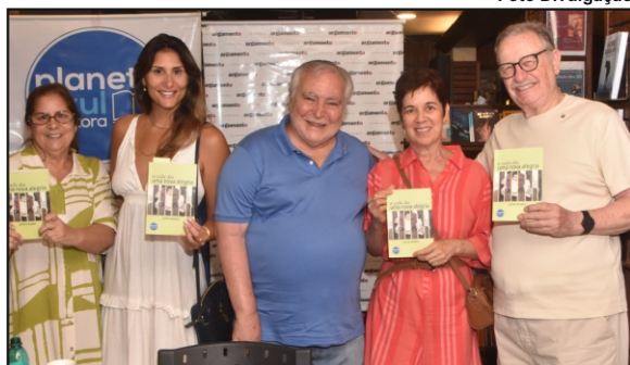
JOPER atraiu dezenas de leitores no lançamento do livro

Em 2001/02 foi Governador do Distrito 4570