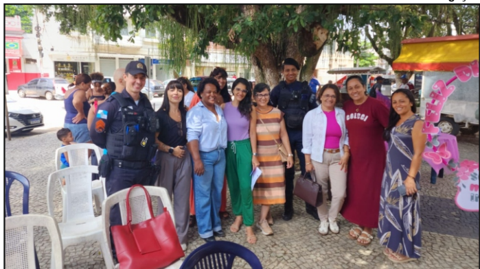
AUTORIDADES municipais participam do evento na praça